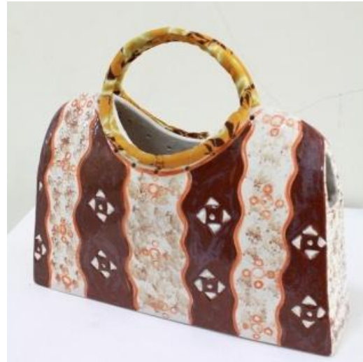
Judul Karya : Komposisi Furlang 2 Ukuran : 23,5 cm x 5 cm x 17,5 cm x 11,5 cm Teknik : Slab, gores Bahan : Stoneware, Kain Sasirangan, Mix Media Finishing : Glasir Suhu Bakar : 1150 0 Tahun : 2013 Dokumentasi : Rafif