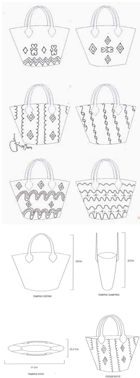
Gambar 3 Sketsa alternatif, sketsa terpilih, gambar proyeksi dan perspektif, judul karya: Komposisi Furlang 1 (Desain dan scan: Sheilla Sonia, 2013)