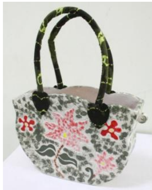
Judul Karya : Komposisi Furlang 3 Ukuran : 24,5 cm x 8,5 cm x 18 cm Teknik : Slab, gores Bahan : Stoneware, Kain Sasirangan, Mix Media Finishing : Glasir Suhu Bakar : 1150 Tahun : 2014