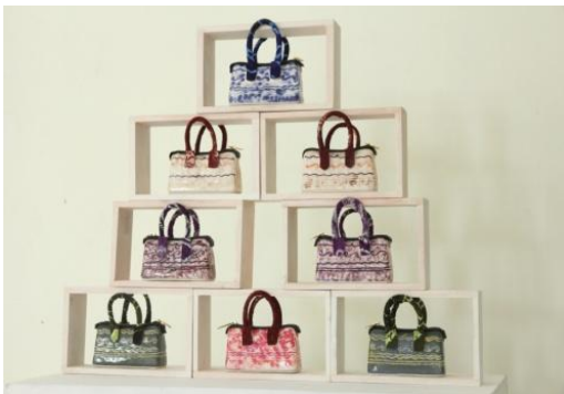
Judul Karya : Komposisi Furlang #1 Ukuran : 12 cm x 2,5 cm x 7 cm Teknik : Slab Casting (cetak tuang), gores Bahan : Stoneware, Kain Sasirangan, Mix Media Finishing : Glasir Suhu Bakar : 1150 0 Tahun : 2014