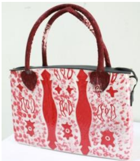
Judul Karya : Komposisi Furlang 5 Ukuran : 29,5 cm x 8 cm x 19,5 cm Teknik : Slab, gores Bahan : Stoneware, Kain Sasirangan, Mix Media Finishing : Glasir Suhu bakar : 1150 Tahun : 2014