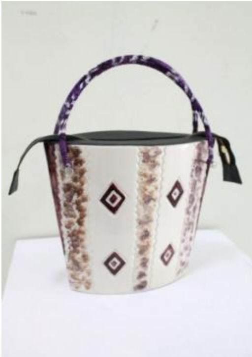
Judul Karya : Komposisi Furlang 1 Ukuran : 11 cm x 2 cm x 22,5 cm Teknik : Slab, gores Bahan : Stoneware, Kain Sasirangan, Mix Media Finishing : Glasir Suhu Bakar : 1150 0 Tahun : 2013