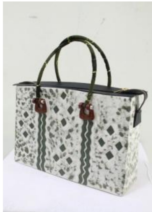
Judul Karya : Komposisi Furlang 6 Ukuran : 30 cm x 8,5 cm x 21 cm Teknik : Slab, gores Bahan : Stoneware, Kain Sasirangan, Mix Media Finishing : Glasir Suhu Bakar : 1150 Tahun : 2014