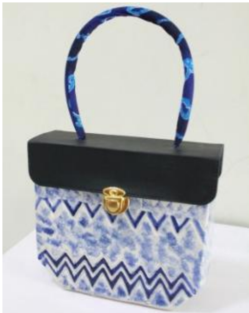
Judul Karya : Komposisi Furlang 4 Ukuran : 21 cm x 17 cm x 7 cm Teknik : Slab, gores Bahan : Stoneware, Kain Sasirangan, Mix Media Finishing : Glasir Suhu Bakar : 1150 Tahun : 2014