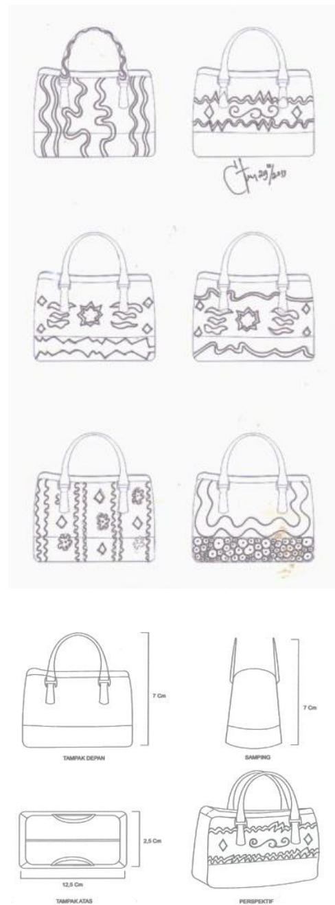
Gambar 23 Sketsa alternatif, sketsa terpilih, gambar proyeksi dan perspektif judul karya: Komposisi Furlang #1 (Desain dan scan: Sheilla Sonia, 20124)