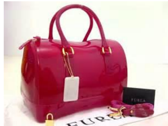
Gambar 1. Tas Furla dengan seri Dragon

dan kain Sasirangan untuk memperoleh keakuratan dan pembuktian adanya keterkaitan dengan konsep karya sebagai bahan referensi. Data diperoleh melalui majalah, internet, foto, sebagai berikut: