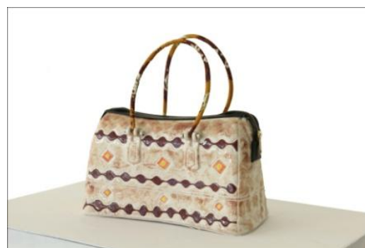
Judul Karya : Komposisi Furlang #2 Ukuran : 29 cm x 13 cm x 20 cm Teknik : Slab Casting (cetak tuang), gores Bahan : Stoneware, Kain Sasirangan, Mix Media Finishing : Glasir Suhu Bakar : 1150 0 Tahun : 2014