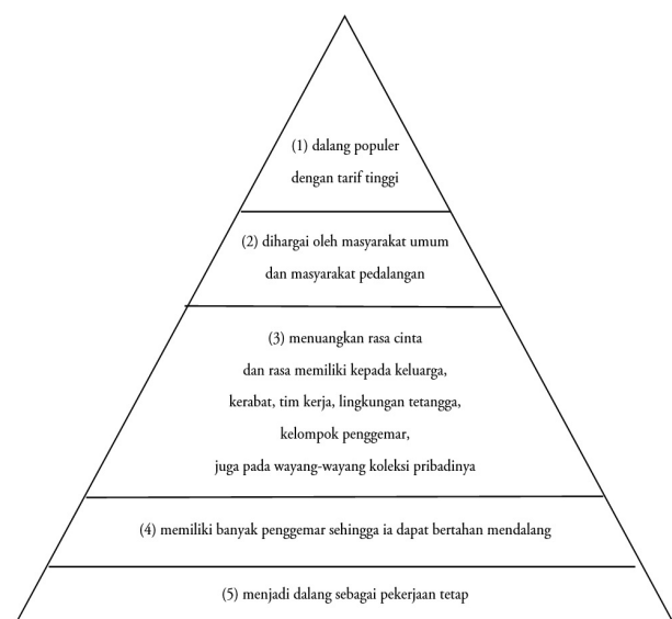
Gambar 2. Piramida pemenuhan kebutuhan Ki Seno Nugroho.

Maslow (1994: 31) berasumsi bahwa manusia tidak berhenti pada satu keinginan, demikian pula subjek yang telah mencapai impian akan kembali berkeinginan mempertahankan mimpinya. Subjek masih memiliki keinginan yang belum terwujud yaitu membangun sanggar lengkap dengan kelir dan gamelan sehingga dapat digunakan sebagai tempat pelatihan mendalang. Mimpi terbesar subjek adalah pertunjukan wayang yang terus berlanjut dan dilestarikan dari generasi ke generasi. Oleh karena itu, subjek berharap anaknya juga turut berperan dalam mewujudkan mimpi terbesarnya itu.