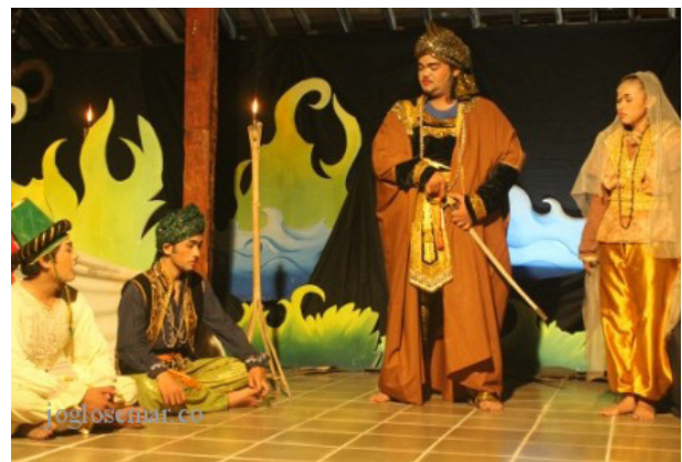
Gambar 1. Pementasan Ketoprak Mesiran dari Kelompok Sanggar Seni Kemasan Surakarta, Lakon Pangeran Arab.