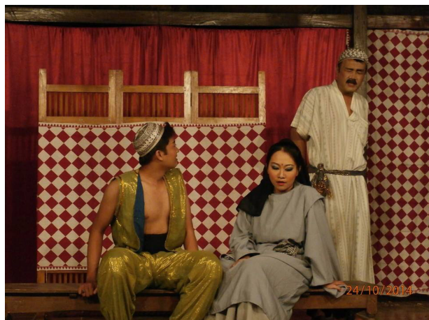
Gambar 4. Kostum rakyat jelata dalam Pementasan Ketoprak Mesiran.