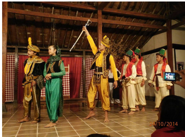
Gambar 3. Kostum prajurit dan pegawai kerajaan dalam Pementasan Ketoprak Mesiran.

Selanjutnya untuk kostum yang digunakan oleh rakyat jelata dalam pementasan ketoprak Mesiran dibuat seperti kostum yang digunakan dalam cerita 1001 Malam. Kostum yang digunakan untuk pemain pria, yaitu celana gombyor, rompi, baju kemeja polos, dan menggunakan aksesoris kepala seperti kopyak atau songkok. Kostum rakyat jelata dapat dilihat pada gambar 4.