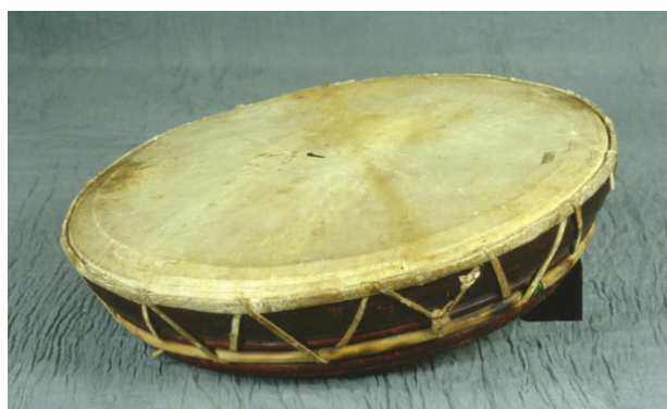
Gambar 5. Instrumen alat musik terbang.