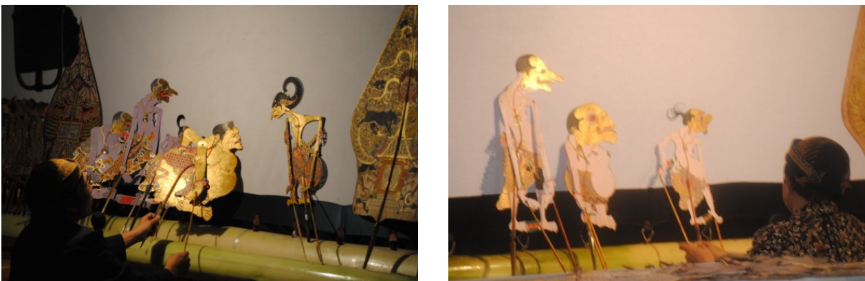
Gambar 3. Contoh adeg sanga sepisan (kiri) diganti dengan adeg gara-gara (kanan).