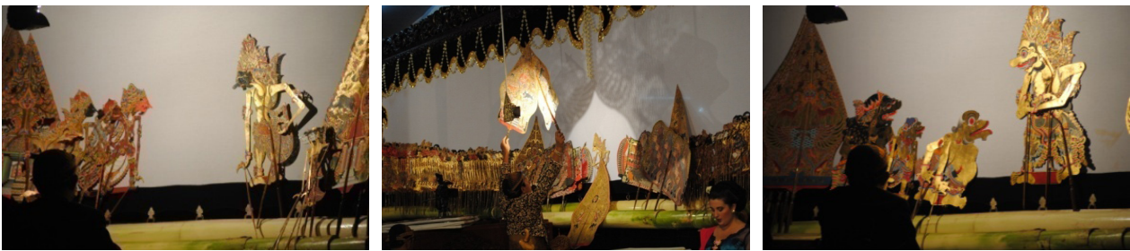
Gambar 1. Contoh jejer berupa persidangan di istana kerajaan (kiri) diubah di medan perang (tengah), dan adeg sabrang (kanan).

Perubahan balungan lampahan yang tertulis dan divisualkan tersebut di atas bersifat parsial, yakni mengurangi ( ngelongi ), menambah ( nambahi ), mengganti ( nggantèni ), dan memindah ( mindhahi ) adegan. Mengurangi