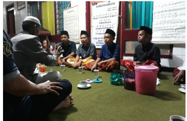
Gambar 3. Tampak kelompok anak-anak dengan serius mengikuti arahan H. Sastro dalam pelatihan Mamaca .