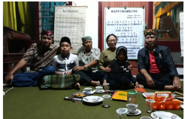
Gambar 4. Peserta anak-anak persiapan latihan bersama untuk regenerasi seni Mamaca di Pamekasan Madura.