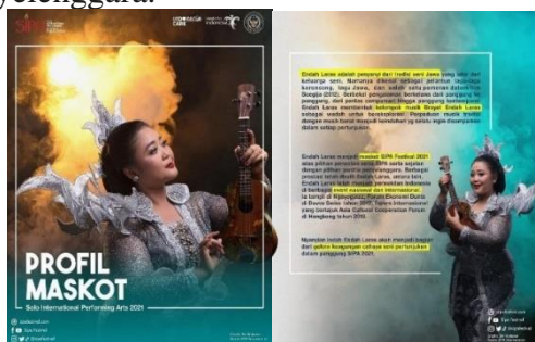
Gambar 3. Poster Publikasi Maskot SIPA 2021

Setelah melewati diskusi panjang antara kurator eksekutif, dewan kurator, dan para panitia SIPA 2021, diputuskan maskot SIPA 2021 adalah seorang pesinden, penyanyi, dan komedian Endah Laras. Pemilihan Endah Laras sebagai wajah baru SIPA dirasa tepat, mengingat kiprah Endah Laras dalam dunia seni musik, tarik suara, dan entertain yang telah teruji oleh waktu dan konsistensi berkesenian, membuat Endah Laras representatif diangkat sebagai maskot SIPA 2021. Endah Laras menjadi maskot SIPA Festival 2021 atas pilihan penonton setia SIPA serta sejalan dengan pilihan panitia penyelenggara.