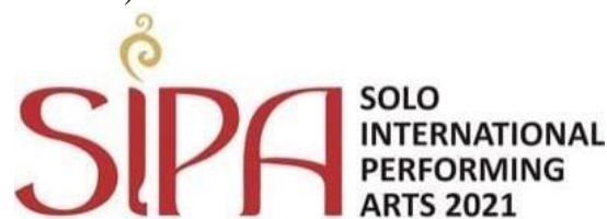
Gambar 1. Logo SIPA 2021

dunia. Solo International Performing Arts (SIPA) mendapatkan penghargaan dari Kementerian Pariwisata dan Ekonomi Kreatif Republik Indonesia (Kemenparekraf) sebagai Top 30 Event Calendar of the Wonderful Event tahun 2019. Selain itu, SIPA juga berhasil meraih penghargaan Anugerah Bangsa Buatan Indonesia (ABBI) 2020 sebagai juara pertama ( www.sipafestival.com , diakses pada 12/05/2022).