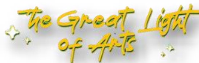
Gambar .4.Design Publikasi Tema SIPA 2021

dan peristiwa yang terjadi di dunia dengan penggunaan kata yang cenderung folisofis. Untuk itu kurator eksekutif memutuskan tema Solo International Performing Arts (SIPA) 2021 dengan tema “ The Great Light of Arts ”.