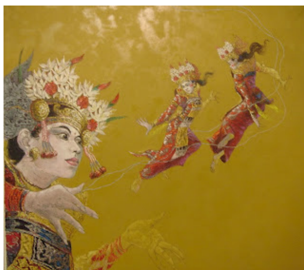
Gambar 7. "Melepas panah merah", 130cm x 130cm 2007, oil on canvas (kiri) dan "Legong", 2007, oil on canvas (kanan).