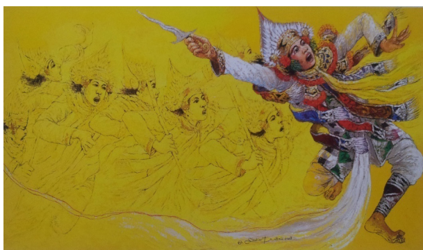
Gambar 5. "Front Leader", 2008, oil on canvas.