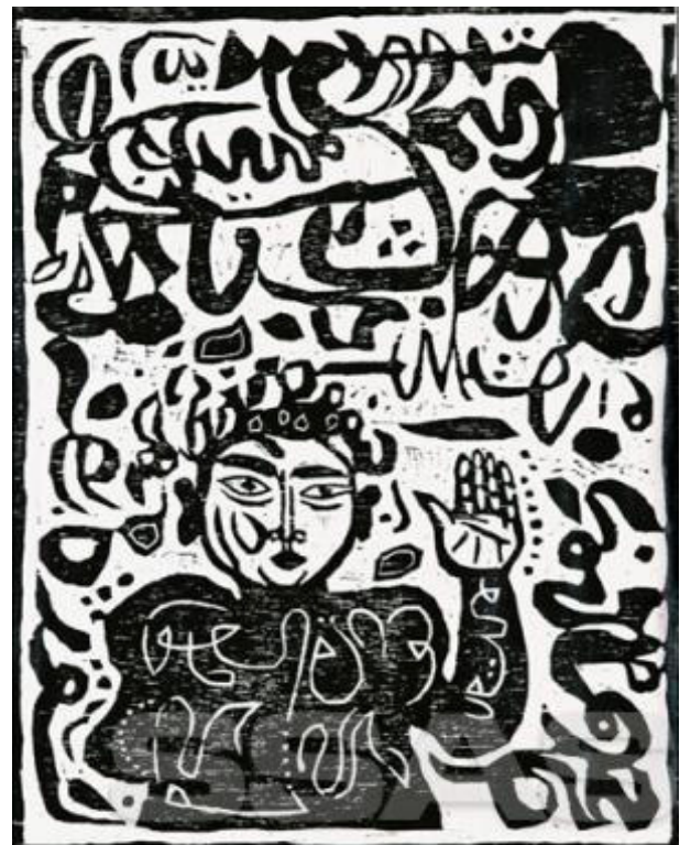
Gambar 1. "Kala Cakra", 2011, woodcut (kiri) dan "Potret Diri", 1987, woodcut (kanan), 43x35 cm.