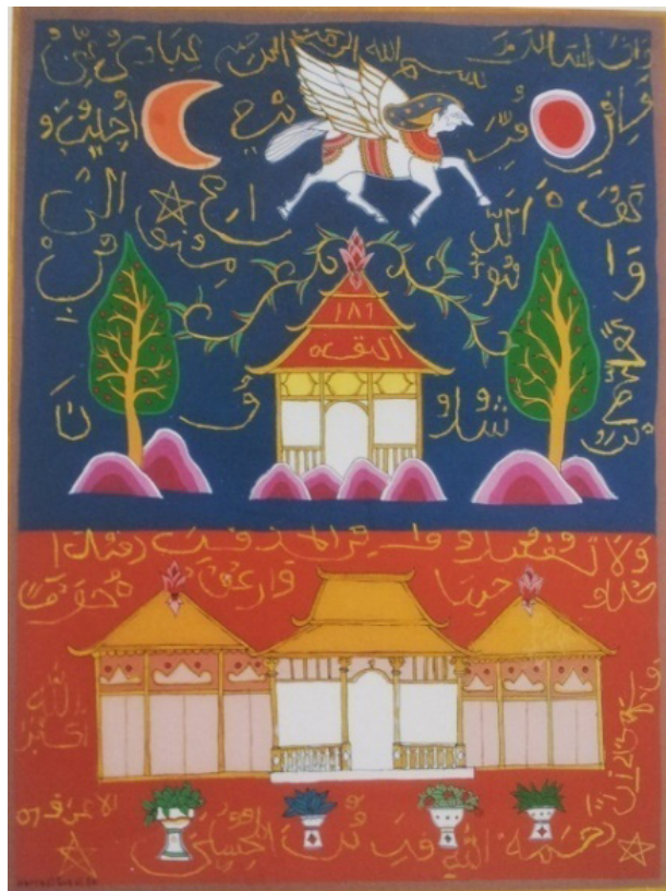
Gambar 2. Haryadi Suadi, lukisan Pawukon 2011, lukisan kaca 48x40 cm.