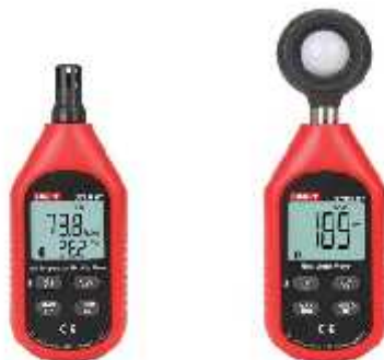
Gambar 1. UNI-T tipe BT333 (kiri) dan BT383 (kanan).

ruang pameran dan ruang penyimpanan koleksi museum. Alat bantu yang digunakan dalam observasi ini antara lain; kamera mirrorless merek Sony A6000 untuk mengambil gambar beresolusi tinggi, alat pengukur suhu, dan kelembapan merek UNI-T tipe UT333, serta alat pengukur intensitas cahaya merek UNI-T tipe UT383.