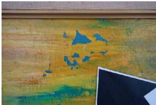
Gambar 3. Kerusakan lukisan akibat faktor inherent vice pada lukisan Bagong Kussudiardja “Sepasang Pengantin”.

Mengingat jumlah koleksi yang mencapai lebih dari 500 lukisan, pembahasan mengenai kerusakan lukisan ini terbatas pada beberapa lukisan yang terdokumentasi. Atas dasar kesamaan metode dan tempat pemeliharaan, beberapa kasus kerusakan yang akan disajikan, dirasa dapat mewakili kondisi kerusakan pada lukisan-lukisan lain yang tidak terekspos seperti pada Gambar 3. Gambar 3 merupakan contoh kerusakan yang disebabkan oleh faktor inherent vice . Hilangnya permukaan cat dan ground layer disebabkan oleh tingkat rekatan yang lemah dari bahan lukisan. Kondisi yang lebih buruk kemungkinan terjadi akibat adanya kontribusi RH yang tidak sesuai membuat permukaan cat menjadi retak.