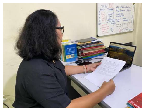
Gambar 3. analisis naskah

Persiapan paling awal sutradara adalah pada naskah itu sendiri. Apa cerita dari adegan dan bagaimana sutradara akan mengisahkan cerita tersebut. Pengisahan cerita yang tentunya melalui gambar yang diambil dari sebuah drone FPV. Sutradara harus sudah memiliki gambaran atau imajinasi kreatif, dimana gambar yang akan dihasilkan dapat menyampaikan informasi, pesan maupun hubungannya dengan tema yang sedang digerakkan dalam cerita tersebut.