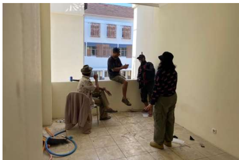
Gambar 6. Sutradara mengarahkan talent/aktor

drone FPV, maka sutradara akan melakukan pembahasan dan pengarahan dengan talent/aktor.