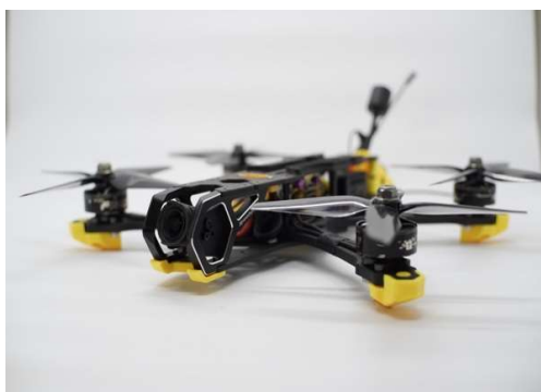
Gambar 1. Drone FPV 5 inchi jenis freestyle

maupun kamera film. Pada penelitian ini drone FPV yang digunakan memiliki ukuran 5 inchi sehingga lebih tepat menggunakan kamera eksternal jenis kamera aksi ( action cam ) yaitu GoPro. Selain itu pada drone FPV sendiri terpasang kamera monitor pilot yang memiliki kualitas 4K dan sudah memenuhi standar semi profesional yang juga dapat merekam gambar dengan baik. Oleh karenanya, hasil pengambilan gambar dapat disesuaikan dengan kebutuhan dan pilihan sutradara apakah gambar bersumber dari hasil rekaman kamera eksternal yaitu kamera Gopro atau cukup menggunakan kamera FPV internal jenis DJI O3. Langkah pertama sutradara adalah menentukan teknis dari hasil yang diharapkan pada penggunaan kamera untuk merekam adegan.