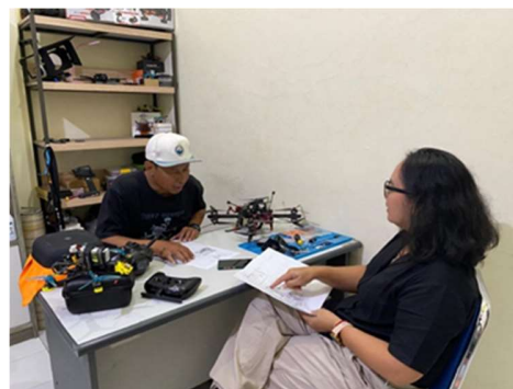
Gambar 5. Sutradara diskusi dengan remote pilot drone FPV

melakukan pengejaran objek yang perlu mempertimbangkan luas pengambilan gambar, kecepatan objek bergerak, lintasan, titik awal dan akhir, operasional kamera bahkan kondisi lingkungan dan cuaca.