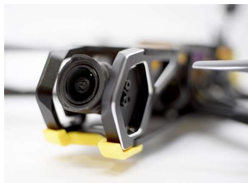
Gambar 2. Kamera drone FPV

murah terlebih memiliki kemampuan manuver gaya bebas.