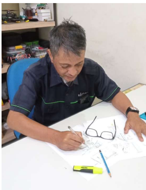
Gambar 4. produksi story board (dokumentasi pribadi)

Seorang sutradara akan memulai penjabaran urutan naskah dan adegan-adegan dalam sebuah penggambaran berupa papan cerita atau yang populer disebut story board . Naskah akan diterjemahkan dalam bentuk gambar-gambar yang bercerita dan juga memberikan gambaran umum dari pengambilan gambarnya maupun gerak dari objek sesuai naskah. Papan cerita akan dikerjakan oleh seorang ahli gambar khusus untuk papan cerita.