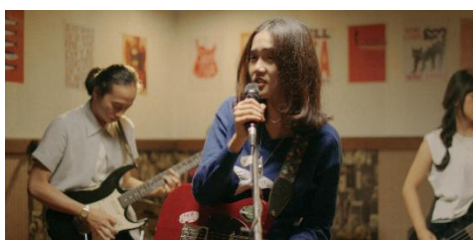
Gambar 1. Still Image film Star Fallin In Me.

elemen dekoratif, melainkan berfungsi sebagai bahasa visual yang mengungkap perjalanan psikologis karakter utama, Hana. Setiap elemen artistik baik wardrobe , palet warna, ruang, maupun properti menjadi tanda yang menyampaikan makna berlapis, mulai dari denotasi, konotasi, hingga mitos. Pembacaan semiotik ini memperlihatkan bagaimana visualisasi dalam film merepresentasikan ambisi narsistik Hana sekaligus keruntuhan egonya ketika berhadapan dengan realitas.