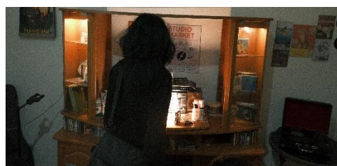
Gambar 7. Still Image film Star Fallin In Me.

Ruang pribadi Hana juga sarat dengan tanda visual. Pada Gambar 6, kamar Hana ditampilkan penuh dengan alat musik, poster, dan studio kecil. Denotasinya jelas: ini adalah kamar seorang musisi remaja. Namun, pada level konotasi, kamar tersebut mencerminkan obsesi Hana terhadap musik sebagai identitas diri. Setiap poster dan alat musik bukan hanya dekorasi, melainkan bukti keterikatannya pada dunia musik. Pada level mitos, kamar Hana menegaskan budaya narsistik remaja yang menempatkan pengakuan eksternal sebagai validasi diri. Keberadaan studio kecil di kamar juga menegaskan mitos tentang pencapaian personal: bahwa kesuksesan dapat diciptakan dari ruang privat, sekaligus menunjukkan isolasi yang dialami Hana dalam mengejar ambisinya.