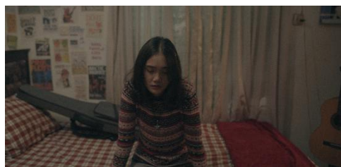
Gambar 6. Still Image film Star Fallin In Me.

Perubahan ini tidak hadir secara kebetulan, melainkan dirancang sejak tahap pra-produksi. Gambar 5 memperlihatkan moodboard produksi yang sudah menyusun pola transisi warna dari warm tone di awal menuju cool tone di akhir. Konsistensi penggunaan warna sepanjang film memperkuat narasi visual tentang perjalanan psikologis Hana: dari optimisme menuju kehampaan.