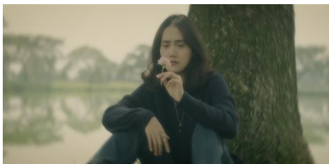
Gambar 2. Still Image film Star Fallin In Me.

Wardrobe merupakan salah satu simbol visual yang paling menonjol dalam film ini. Pada Gambar 1, Hana mengenakan sweater biru berlogo bintang. Secara denotatif, sweater ini hanya dipahami sebagai pakaian berwarna biru dengan simbol bintang di bagian depan. Namun, pada level konotasi, bintang tersebut menyiratkan harapan Hana untuk bersinar dan meraih pengakuan sebagai musisi muda. Warna biru pada pakaian memberi kesan tenang, tetapi simbol bintang mempertegas keinginannya untuk tampil menonjol. Pada level mitos, sweater ini menjadi representasi dari budaya narsistik remaja yang kerap mengukur harga diri melalui pencapaian eksternal, khususnya popularitas di dunia musik.