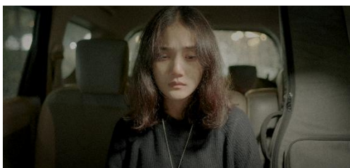
Gambar 4. Still Image film Star Fallin In Me.

Namun, transisi warna terjadi seiring perkembangan cerita. Pada Gambar 4, palet visual bergeser ke cool tone dengan dominasi biru dan abu-abu. Secara denotatif, ini adalah gradasi warna dingin. Konotasinya menyiratkan rasa hampa, gagal, dan kesepian yang dialami Hana ketika konflik dengan teman bandnya memuncak. Pada level mitos, warna dingin ini menandakan kerapuhan psikologis akibat tekanan narsistik: ambisi besar yang tidak sejalan dengan realitas memunculkan kehampaan emosional yang mendalam.