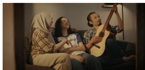
Gambar 3. Still Image film Star Fallin In Me.

Sebaliknya, pada Gambar 2, Hana mengenakan sweater biru polos tanpa simbol. Secara denotasi, pakaian ini hanyalah sebuah sweater sederhana tanpa ornamen visual. Namun, konotasinya menandai perubahan drastis dalam kondisi psikologis Hana. Hilangnya simbol bintang mencerminkan runtuhnya kepercayaan diri dan sirnanya aspirasi untuk bersinar. Pada level mitos, pakaian ini mengartikulasikan keruntuhan ego narsistik: ketika ambisi tidak tercapai, identitas yang dibangun di atas pengakuan eksternal pun kehilangan makna. Perubahan wardrobe ini memperlihatkan bagaimana visual sederhana dapat mengomunikasikan dinamika emosional yang kompleks.