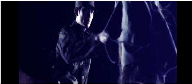
Gambar 5. Penggambaran kilas balik pelatihan militer di Korea Utara (Sumber: “ Secretly Greatly ” (2013) TC: 46:32).

Adegan kilas balik yang memperlihatkan pelatihan di Korea Utara (Gambar 5) dibingkai dengan sinematografi dingin: palet warna biru kelabu, cahaya minim, dan lanskap beku — memperkuat suasana tertindas dan keras.