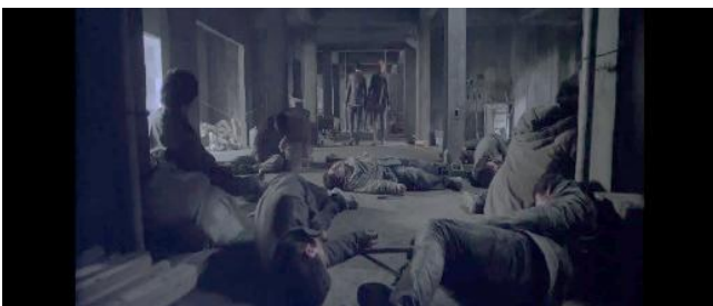
Gambar 9. Penggambaran bagaimana ideologi brutal berujung sia-sia (Sumber: “ Secretly Greatly ” (2013) TC: 1:42:25).

Adegan eksekusi dan darah (Gambar 9): Menjelang klimaks film, ketiga agen diperintahkan untuk saling membunuh atau bunuh diri demi menghapus bukti infiltrasi. Kemudian, karena dianggap memberontak, ketiganya menjadi buronan.