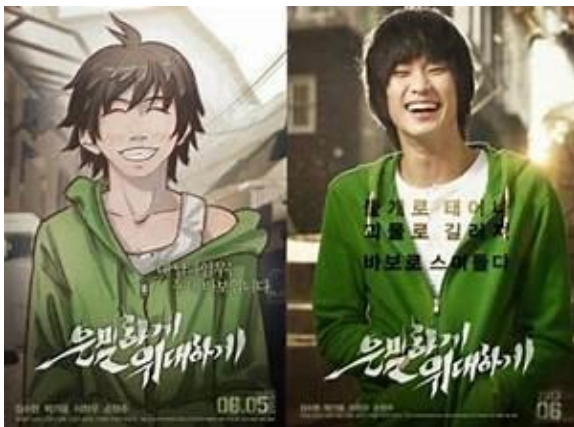
Gambar 2. Poster webtoon “ Covertness ” (kiri) dan poster film “ Secretly Greatly ” (kanan) (Sumber:

https://static.tvtropes.org/pmwiki/pub/images/sg_0.png ).