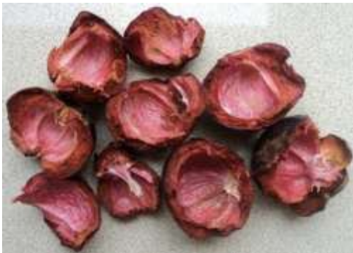
Gambar 4. Kulit Buah Manggis ( Garcinia mangostana L.)

Buah manggis ( Garcinia mangostana L.), merupakan buah yang eksotik karena memiliki warna yang menarik dan kandungan gizi yang tinggi. Potensi manggis tidak hanya terbatas pada buahnya saja, tetapi juga hampir seluruh bagian tumbuhan manggis menyimpan potensi yang sangat bermanfaat bagi kehidupan manusia.