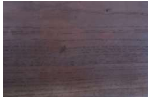
Gambar 12. Hasil aplikasi ekstrak daun sirih dan injet ke kayu surian menghasilkan warna ungu

3). Sirih dan injet, ditumbuk dalam lumpang, ekstraksnya berwarna merah, diaplikasikan ke kayu surian menggunakan kuas, menghasilkan warna ungu.