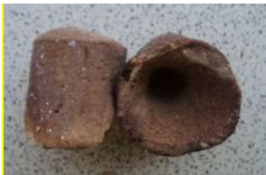
Gambar 2. Getah gambir olahan

Tanaman getah gambir sebagai salah satu sumber bahan warna merupakan tanaman perdu termasuk famili Rubiace (kopi-kopian). Selama ini getah gambir sebagian besar digunakan untuk zat pewarna dalam industri batik, industri penyamak kulit, ramuan makan sirih, bahan baku pembuatan permen dan sebagai penjernih pada industri air. Di lain pihak getah gambir sangat potensial untuk diaplikasikan pada bahan finishing, di antaranya untuk keperluan pewarnaan kayu.