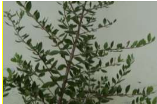
Gambar 5. Rumpun Inai batang ( Lawsonia inermis )

Inai ( Lawsonia inermis ) tumbuhan semak, daunnya untuk pemerah kuku; pacar; adalah sejenis pokok yang mempunyai khasiat untuk obat terutamanya bahagian daunnya. Pokok inai yang mempunyai banyak ranting ini mendapat namanya daripada perkataan Arab 'Hina' yang bermaksud obat. Daun inai mengandung bahan pewarna glukosid dan asid henotanik . Asid henotanik pada daun inai menyebabkan benda yang dikenai inai akan berwarna merah.