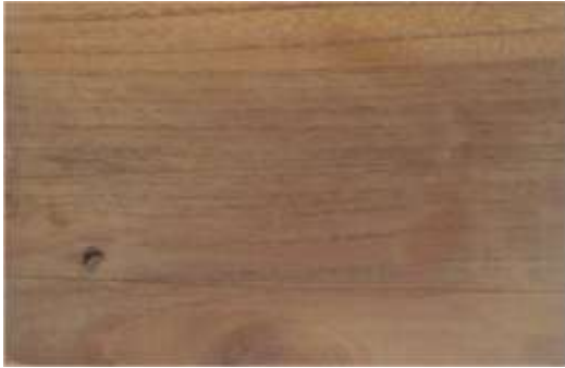
Gambar 14. Hasil aplikasi ekstrak inai batang dan injet ke kayu surian menghasilkan warna coklat muda

6). Kulit jengkol, ditumbuk dalam lumpang, ekstraksinya berwarna ungu, diaplikasikan ke kayu surian dengan di lulur/tabur, menghasilkan warna coklat-abu-abu.