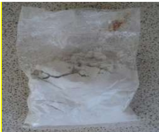
Gambar 7. Injet atau kapur sirih dalam kemasan

Injet atau kapur sirih merupakan produk olahan dari kulit atau cangkang lokan dan kerang yang dibakar kemudian ditumbuk. Injet dalam bahasa Minangkabau disebut sadah dalam masyarakat digunakan sebagai pelengkap untuk makan sirih, sehingga menghasilkan warna merah. Injet yang digunakan bersamaan dengan sirih dapat memperkuat gigi.