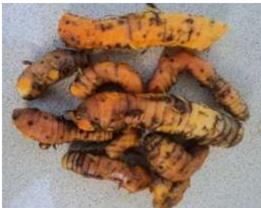
Gambar 1. Rimpang Kunyit ( Curcuma domestica Val )