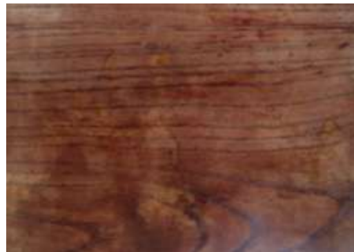
Gambar 13. Hasil aplikasi ekstrak kulit manggis ke kayu surian menghasilkan warna coklat tua

4). Kulit Buah Manggis, ditumbuk dalam lumpang, ekstraksnya berwarna merah muda, diaplikasikan ke kayu surian dengan dilulur/tabur, menghasilkan warna coklat tua.