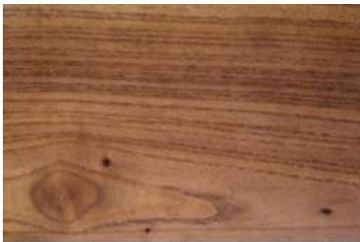
Gambar 15. Hasil aplikasi ekstrak kulit buah jengkol ke kayu surian menghasilkan warna coklat keabu-abuan

6). Kulit jengkol, ditumbuk dalam lumpang, ekstraksinya berwarna ungu, diaplikasikan ke kayu surian dengan di lulur/tabur, menghasilkan warna coklat-abu-abu.