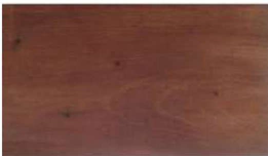
Gambar 11. Hasil aplikasi ekstrak getah gambir dan injet ke kayu surian menghasilkan warna merah maron

2). Getah gambir dan injet, dilarutkan dalam air, ekstraksnya berwarna merah kehitaman, diaplikasikan ke kayu surian menggunakan kuas, menghasilkan warna merah maron.