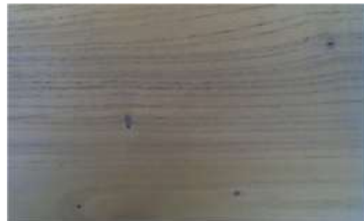
Gambar 8. Papan kayu surian, media aplikasi pewarna alam

bebas cabang hingga 25 m. Diameter dapat mencapai 100 cm, bahkan di pegunungan dapat mencapai hingga 300 cm. Berbanir hingga tinggi 2 m. Kulit batang terlihat pecah-pecah dan seolah tumpang tindih, berwarna coklat keputihan, pucat hingga keabu abuan, dan mengeluarkan aroma apabila dipotong. Kayunya ringan, dengan gubal merah muda dan teras coklat.