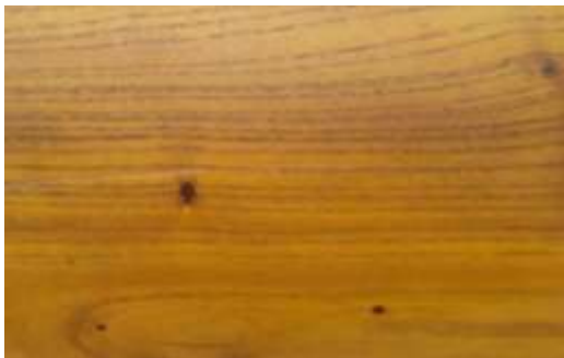
Gambar 10. Hasil aplikasi ekstrak kunyit ke kayu surian menghasilkan warna kuning

1). Kunyit; dihaluskan dengan di blender, ekstrak berwarna kuning, kemudian disaring. Ekstraknya dipoles ke kayu surian menggunakan kuas, warna yang dihasilkan adalah kuning.