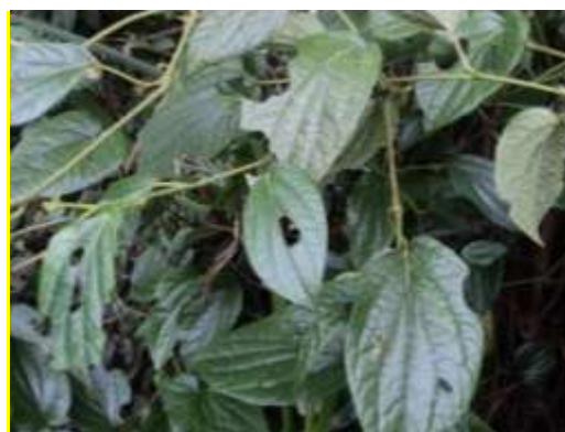
Gambar 3. Rumpun Sirih ( Piper betle L.)

Tanaman merambat ini bisa mencapai tinggi 15 m. Batang sirih berwarna coklat kehijauan, berbentuk bulat, beruas dan merupakan tempat keluarnya akar. Daunnya yang tunggal berbentuk jantung, berujung runcing, tumbuh berselang-seling, bertangkai, dan mengeluarkan bau yang sedap bila diremas. Panjangnya sekitar 5 - 8 cm dan lebar 2 - 5 cm. Bunganya majemuk berbentuk bulir dan terdapat daun pelindung ± 1 mm berbentuk bulat panjang. Pada bulir jantan panjangnya sekitar 1,5-3 cm dan terdapat dua benang sari yang pendek sedang pada bulir betina panjangnya sekitar 1,5-6 cm di mana terdapat kepala putik tiga sampai lima buah berwarna putih dan hijau kekuningan. Buahnya buah buni berbentuk bulat berwarna hijau keabu-abuan. Akarnya tunggang, bulat dan berwarna coklat kekuningan.