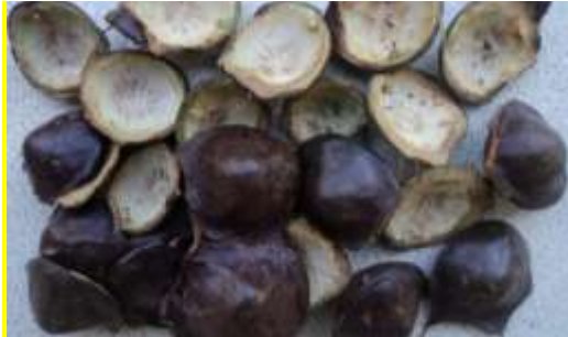
Gambar 6. Tumbuhan Inai batang

hitam dengan selubung biji putih atau ros yang tidak sempurna.