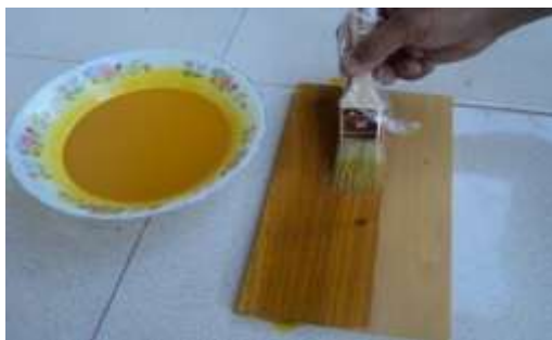
Gambar 9. Pengaplikasian ekstrak kunyit ke kayu surian menggunakan kuas

Setelah diperoleh ekstraksi dari kunyit, getah gambir, sirih, inai batang, kulit buah manggis, kulit jengkol, dan injet maka langkah selanjutnya pengaplikasian ke media kayu surian.