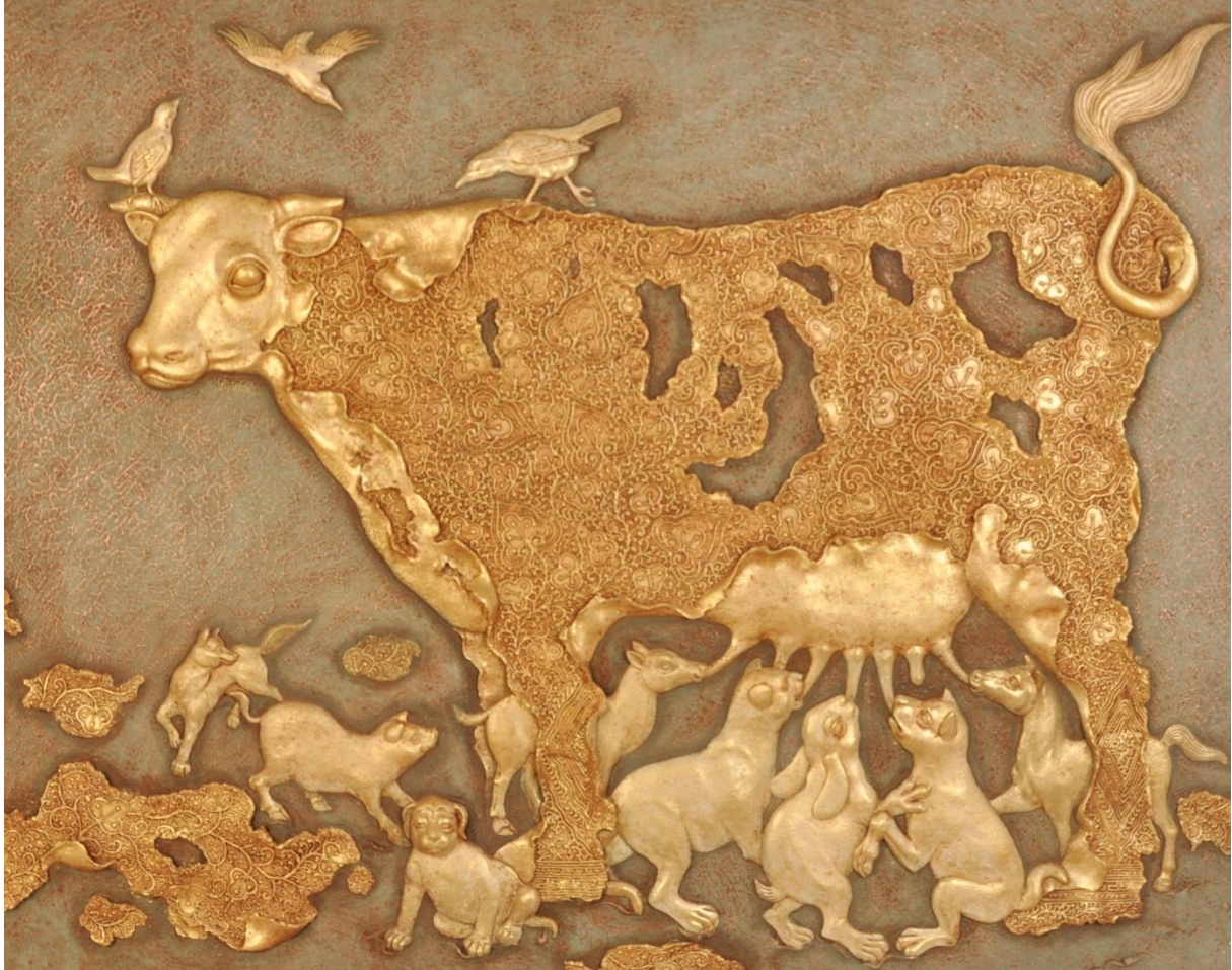
I Made Sukanadi Ikhlas untuk Sesama MIX MEDIA 120 x 140 cm 2013