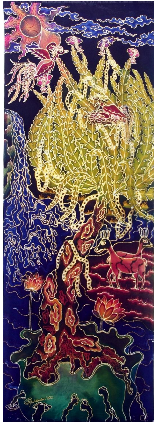
Judul : " Kehidupan Bhuvah Loka " Media : Kain Bercoline Warna : Indigosol, Remasol, dan Naphthol Teknik : Batik Tulis Lorodan Ukuran : 240 cm x 90 cm Tahun : 2012

keluar, namun di dalam karya ini pohon hayat digambarkan dengan pohon yang tumbuh di dalam telakupan daun teratai.