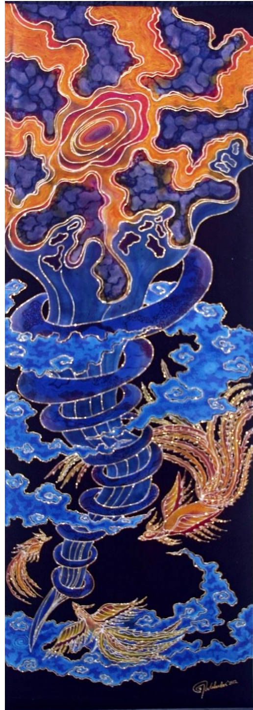
Judul : "Kehidupan Alam Sakala" Media : Kain Bercoline Warna : Indigosol, Remasol, dan Napthol Teknik : Batik Tulis Lorodan Ukuran : 240 cm x 90 cm Tahun : 2012 Foto : Widodo Yuswanto

Secara keseluruhan dalam penggunaan simbol-simbol kehidupan digambarkan dalam bentuk yang sudah distilisasi atau digayakan, namun tidak merubah secara total dari bentuk aslinya. Dalam pengayaan sebuah bentuk dapat digunakan sebagai tolok ukur sejauh mana kemampuan dan imajinasi seseorang dalam memvisualisasikan ide dan gagasan yang ada dalam pikiran ke dalam sebuah karya.