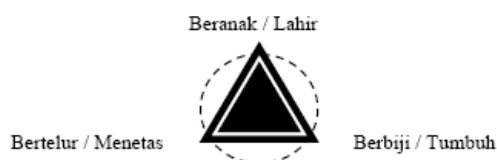
Gambar 3. Hubungan Beranak, Bertelur, dan Berbiji

Dalam konsep Tribuana/Triloka, pohon hayat merupakan simbol kehidupan. Asal kehidupan adalah dari Tuhan dan dengan perjalanan sesuai masa maka akan kembali kepada-Nya. Dalam kehidupan di dunia ini ada tiga tanda untuk mengetahui adanya awal kehidupan, yakni dengan cara lahir, bertelur, dan tumbuh. Hal tersebut dicontohkan seperti kancil dengan cara beranak, burung dengan cara bertelur, dan bunga teratai dengan cara berbiji. Ketiga cara asal kehidupan tersebut menurut penulis dapat digambarkan dengan bentuk bagan segitiga sebagai berikut ini: Beranak / Lahir