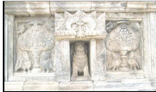
Gambar 1. Motif Prambanan. Di bagian tengah terdapat relief singa dalam relung yang diapit oleh ornamen relief Kalpataru.

Ornamen relief Kalpataru merupakan salah satu ornamen yang ada di Kompleks Candi Prambanan, khususnya terdapat pada motif Prambanan. Ornamen relief Kalpataru divisualisasikan dengan pohon hayat dan unsur yang menyertainya. Pohon hayat ( tree of life ), dalam agama hindu disebut dengan istilah kalpavrksa , kalpadruma , kalpataru , kalpadaru atau kalpavalli . Istilah kalpavrksa berasal dari kata kalpa yang berarti keinginan, masa dunia, jaman, harapan, nama, dan arca. Perkataan vrksa , druma , taru , daru dan valli berarti pohon atau kayu, sehingga arti istilah kalpavrksa , kalataru , kalpadaru , kalpavalli atau kalpadruma , ialah pohon pengharapan, pohon masa dunia, pohon zaman atau pohon keinginan (Maryanto, 2003: 60).