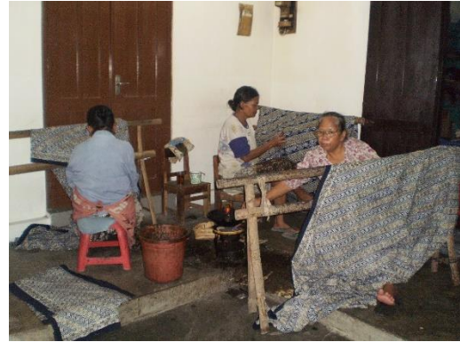
Gambar 3. Beberapa Pegawai Batik TOPO sedang membatik.

Batik TOPO mempunyai pegawai sekitar 25 orang yang berdiri pada tahun 1981. Usaha batik TOPO sudah berdiri selama 29 tahun, melewati berbagai peristiwa seperti krisis moneter dan gempa bantul 2006. Pada saat gempa, usaha batik TOPO tidak mengalami musibah yang berarti, tetapi memberikan bantuan untuk penduduk sekitar yang mengalami musibah gempa.