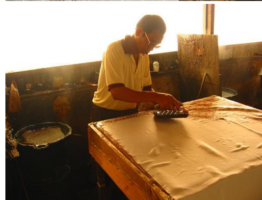
Gambar 14. Pengerjaan Batik Cap.

Proses pewarnaan dilakukan setelah pematikan. Proses pewarnaan dibedakan menjadi dua macam yaitu pencelupan dan pencoletan. Proses pencelupan adalah kain yang telah dibatik dengan lilin dimasukkan ke dalam air dengan bahan pewarna. Proses pencoletan adalah pewarnaan dengan menggunakan media kuas atau sikat untuk menorehkan bahan pewarna pada kain batik. Proses pencelupan dan pencoletan dapat dilakukan berulang kali untuk mendapatkan warna yang maksimal.