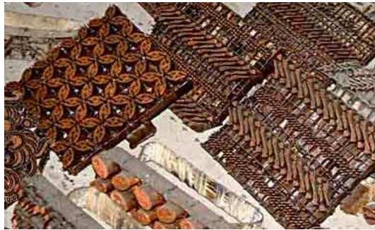
Gambar 12. Alat Cap batik.

Membatik, baik itu batik tulis maupun cap, melalui empat tahap proses pematikan. Tahap-tahap tersebut adalah tahap persiapan, pematikan, pewarnaan dan penghilangan warna. Tahap persiapan dimulai dengan pencucian bahan kain dengan air. Fungsinya adalah untuk menghilangkan lapisan tepung kanji yang biasanya terdapat dalam bahan kain. Lapisan tepung kanji yang telah hilang ini membuat kain lebih lentur dan luwes untuk dibatik. Proses pencucian bahan kain batik dinamakan dengan nggirah (Sewan Susanto, 1973:6).