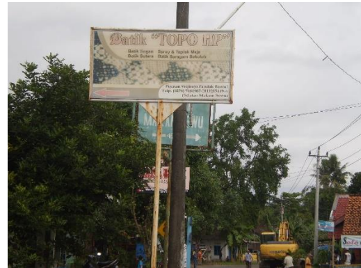
Gambar 1. Lokasi Batik TOPO Bantul.

aspalnya halus berliku-liku melewati banyak tikungan dan persimpangan.