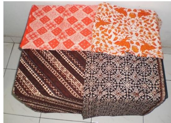
Gambar 8. Koleksi produk-produk kain Batik TOPO Bantul