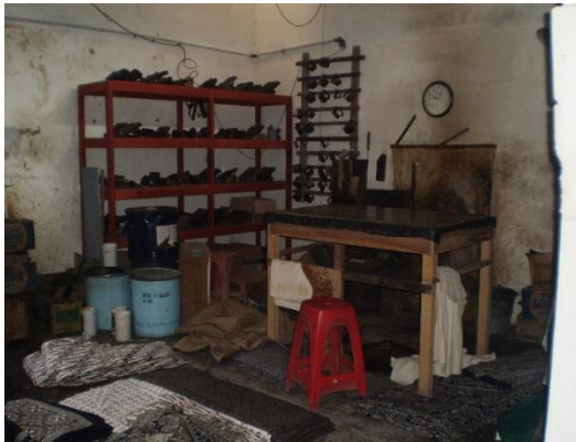
Gambar 6. Beberapa Cap Batik Koleksi Batik TOPO dan Ruang Kerja Topo HP.

rasa. Rasa adalah daya penggerak tingkah laku dan kreatifitasnya (M. Dwi Marianto, 2006:41). Topo HP menerima pesanan batik cap dan mempunyai peralatan cap yang sudah dimiliki bertahun-tahun lamanya.