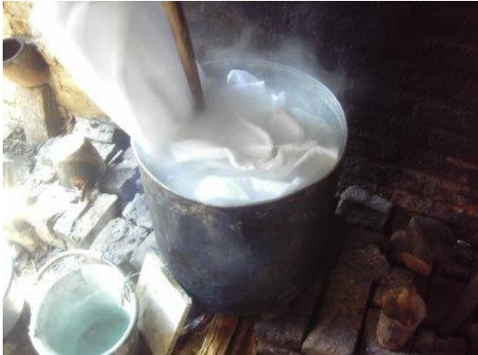
Gambar 16. Pengerjaan Nglorot .

Tahap penghilangan lilin dinamakan juga dengan nglorot . Prosesnya adalah dengan cara merendam kain ke dalam air mendidih yang telah dicampur dengan kanji atau soda abu. Fungsinya untuk melepaskan lilin dari kain batik. Kain batik yang telah bersih dari lilin kemudian dijemur dengan cara diangin-anginkan.