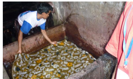
Gambar 15. Proses Pewarnaan.

Proses pewarnaan dilakukan setelah pematikan. Proses pewarnaan dibedakan menjadi dua macam yaitu pencelupan dan pencoletan. Proses pencelupan adalah kain yang telah dibatik dengan lilin dimasukkan ke dalam air dengan bahan pewarna. Proses pencoletan adalah pewarnaan dengan menggunakan media kuas atau sikat untuk menorehkan bahan pewarna pada kain batik. Proses pencelupan dan pencoletan dapat dilakukan berulang kali untuk mendapatkan warna yang maksimal.