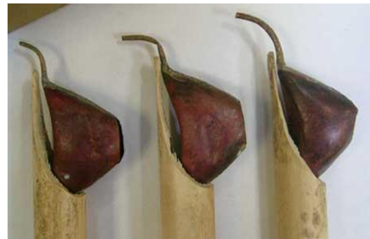
Gambar 11. Canting.

pada kain (Biranul Anas, 1997: 14). Canting adalah alat utama batik tulis terbuat dari tembaga ringan, mudah dilenturkan, tipis namun kuat dipasangkan pada gagang buluh bambu yang ramping. Bagian tembaga yang berbentuk teko kecil merupakan tempat penampungan cairan malam dan corong berlubang yang terdapat pada teko merupakan tempat mengalirnya cairan malam.