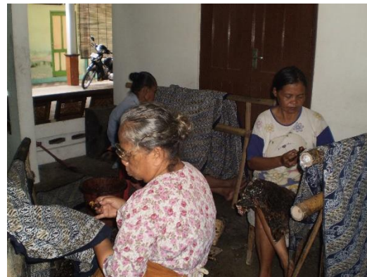
Gambar 4. Suasana Pembatikan di Batik TOPO.