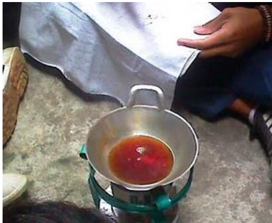
Gambar 10. Kompor dan Wajan.

Bahan pewarna untuk pembatikan ada bermacam-macam jenisnya. Jenis pewarna batik yaitu indigosol, rapid, naphthol dan warna alami. Bahan lainnya dalam pembatikan adalah kompor dan wajan batik.