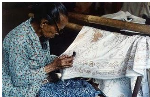
Gambar 13. Pengerjaan Batik Tulis.

Tahap selanjutnya adalah pematikan. Tahap pematikan adalah proses penggambaran corak dengan menggunakan canting cap atau canting tulis untuk menorehkan malam pada kain. Proses penggambaran corak ini biasanya mengikuti disain motif pada kain. Bahan kain digambar menggunakan pensil dulu, selanjutnya dibatik.