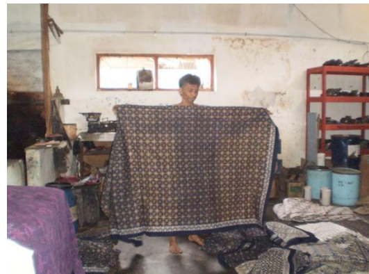
Gambar 5. Tempat Pencelupan dan Pengcepan Batik TOPO.

Karyawan batik TOPO berasal dari wilayah Bantul dan sekitarnya. Walaupun memiliki beberapa karyawan, Bapak Topo masih mengerjakan pesanan batik cap dari konsumennya. Membatik seperti sudah menjadi bagian yang tidak terpisahkan dari kehidupannya. Topo HP membatik dengan