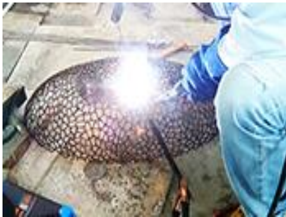
4.1.a) Perakitan dengan melakukan pengelasan dari sisi luar, menyebar ke semua permukaan (dokumen pribadi, 2020).

Perakitan atau assembling , yang dimaksud di sini adalah menyempurnakan sambungan-sambungan dari potongan as stainless steel yang kecil, yang semula sudah disambung pada pengelasan pada cetakan, namun kualitas lasnya hanya sekedar nempel. Untuk perakitan ini, kualitas lasnya disempurnakan pada bagian pertemuan masing-masing potongan as stainless steel agar karya oval menjadi lebih kuat dan kokoh. Selain itu agar hasil las pada perpotongan tadi ketika dipapras menggunakan mesin gerinda, hasilnya tetap bagus dan sambungan tetap kuat. Namun dampak dari pengelasan ulang pada proses perakitan ini, karya oval menjadi berubah warna hitam gosong akibat terkena panas yang cukup banyak. Setelah pengelasan ulang dirasa cukup rata dan sempurna, maka selanjutnya masuk ke tahap finishing .