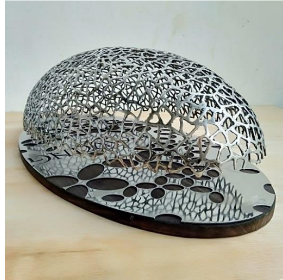
Pengembangan hasil penelitian yang dikombinasikan dengan kayu mahogany dan plat stainless steel 304 . Judul karya: the Soul of Kawung .

Hasil riset ini, oleh penulis juga sudah coba untuk digabungkan dengan bahan lain, sebagai salah satu pengembangan hasil penelitian.