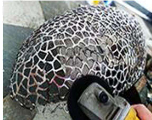
4.2.d) Memoles permukaan oval dengan langsol dan mata gerinda kain jeans poles (dokumen pribadi, 2020).