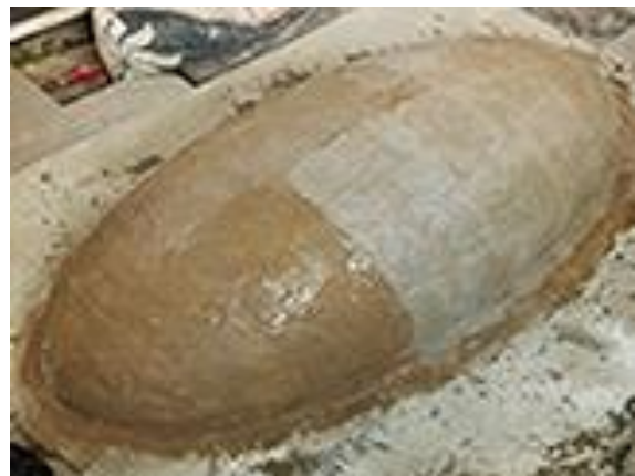
2.b) Proses pelapisan cetakan, ada 3 lapis yang selalu disisipkan lembaran serat kaca (dokumen pribadi, 2020).