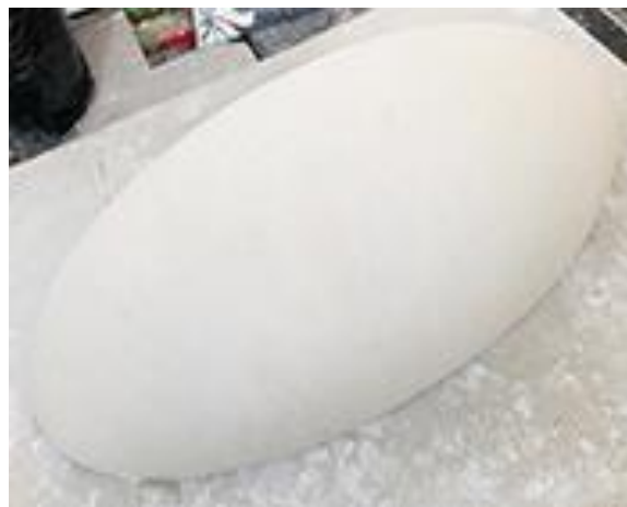
1.d) Bentuk oval yang sudah dihaluskan menggunakan penggaris stainless (dokumen pribadi 2020)