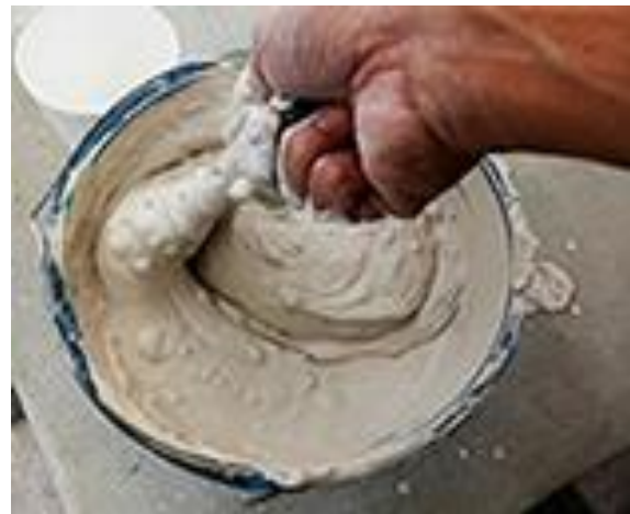
1.b) Membuat adonan gypsum dan kalsit untuk memplester adonan menjadi bentuk oval (dokumen pribadi 2020)