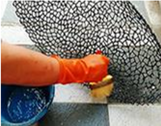
4.2.a) Pembersihan hasil las yang gosong dengan gel pembersih stainless steel (dokumen pribadi, 2020).