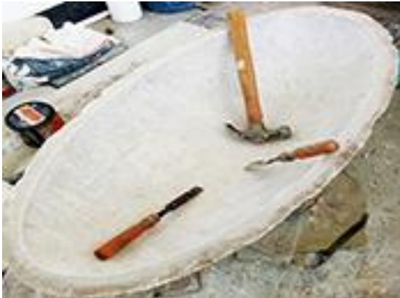
2.d) Merapikan sisi dalam cetakan untuk proses pengerjaan tahap berikutnya (dokumen pribadi, 2020).