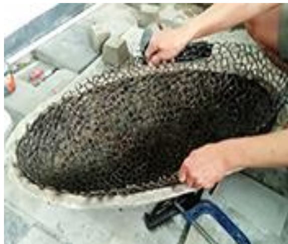
3.d) Mengeluarkan hasil las dari cetakan untuk lanjut ke tahap selanjutnya.