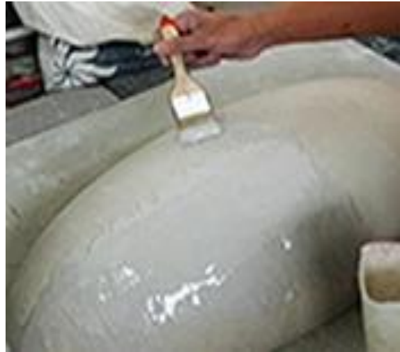
2.a) Pemlesteran adonan resin, talek, dan katalis di lapisan pertama pada permukaan bentuk oval (dokumen pribadi, 2020).

Membuka cetakan dan memisahkan cetakan dari model oval. Tahap ini dimulai dari memahat cetakan resin dan serat kaca tadi agar lepas dari alas tempat model oval berada. Karena cukup lengket, walaupun sudah menggunakan wax , maka dibarengi dengan pemotongan cetakan yang berlebih dengan menggunakan mesin gerinda. Setelah cetakan bisa lepas dari alasnya, selanjutnya usaha mengeluarkan model dari dalam cetakannya. Jika cukup sulit, bisa dibantu dengan alat pahat untuk mencongkelnya. Setelah model bisa dikeluarkan, permukaan dalam cetakan langsung dirapihkan untuk digunakan dalam proses berikutnya yaitu pengelasan pada cetakan.