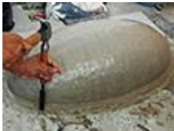
2.c) Pelepasan cetakan dari alas. Jika sulit dilepas dapat menggunakan alat pahat dan palu (dokumen pribadi, 2020).