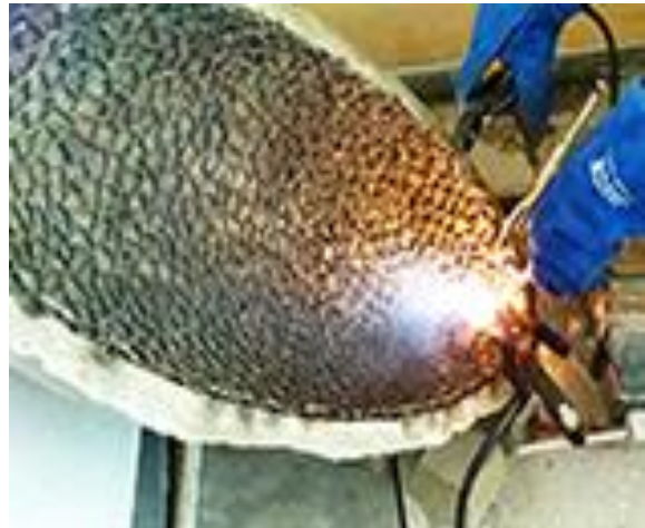
3.c) Proses pengelasan pada bagian tepi cetakan oval (dokumen pribadi 2020).

Ketika cetakan sudah dipersiapkan dan sisi dalamnya sudah dirapikan, selanjutnya masuk tahap pengelasan pada cetakan. Karena sisi dalam cetakan tersebut permukaannya melengkung, maka bahan as stainless steel harus dibengkokkan sedikit dan dipotong kecil-kecil sekitar 2cm agar mudah dilas dan hasil lasnya sesuai dengan permukaan lengkung tersebut. Selanjutnya proses pengelasan as stainless steel pada sisi dalam cetakan dimulai, awalnya dari tengah dulu, selanjutnya secara bertahap menyebar ke luar sampai batas cetakan. Setelah selesai melakukan pengelasan sampai batas-batas tepi cetakan, proses pengeluaran stainless steel dari cetakan pun siap dilakukan. Dan mulai masuk ke tahap akhir.