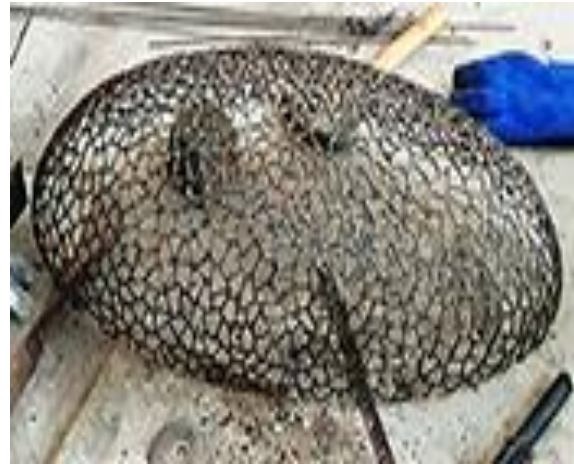
4.1.b) Pengelasan sisi luar telah selesai, karya menjadi hitam gosong, siap masuk tahap finishing (dokumen pribadi, 2020).