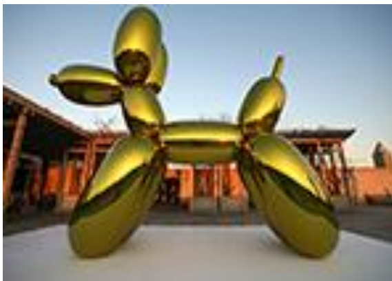
Gambar 1. Karya pematung Jeff Koons, Balloon Dog (Yellow) , 2008, di the Cantor Roof Garden-the Metropolitan Museum of Art, New York.

Pesatnya perkembangan bentuk 3 dimensi disertai dengan kecenderungan gaya, bentuk, bahan, dan teknik, telah merangsang bermunculan berbagai kecenderungan karya 3 dimensi yang kekinian (kontemporer). Salah satunya adalah penerapan bahan stainless steel pada bentuk 3 dimensi dengan permukaan melengkung. Sebut saja seperti karya Jeff Koons dan Anish Kapoor. Bentuk karya dua seniman internasional ini beberapa di antaranya menggunakan bahan stainless steel pada bentuk 3 dimensi dengan permukaannya melengkung. Bentuk 3 dimensi dengan permukaan melengkung berbahan stainless steel ini juga ada yang diterapkan pada furniture dan benda-benda fungsional lainnya.