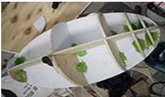
1.a) Konstruksi dari bahan multiplek, sebagai panduan bentuk oval (dokumen pribadi 2020)

Memplester adonan gypsum ( calcium sulfate ) dan kalsit ( calcium carbonate ) membentuk oval. Mulai dari membuat adonan gypsum dan kalsit dengan perbandingan 1:1. Dalam kondisi kering, adonan diaduk hingga rata, dan sedikit demi sedikit dicampur air hingga tercapai adonan yang bisa dipleset, tidak terlalu encer, dan tidak terlalu kental. Adonan dipleset sedikit demi sedikit pada konstruksi panduan multiplek tadi hingga terbentuk wujud ovalnya. Dan agar tercapai bentuk oval yang halus dan rata, digunakan penggaris stainless yang bisa dilengkungkan, untuk meratakan permukaan dengan dipapras secara perlahan dan bertahap hingga tercapai bentuk oval yang diinginkan.