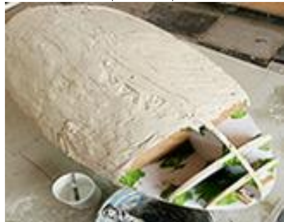
1.c) Memplester adonan menjadi bentuk oval (dokumen pribadi 2020)