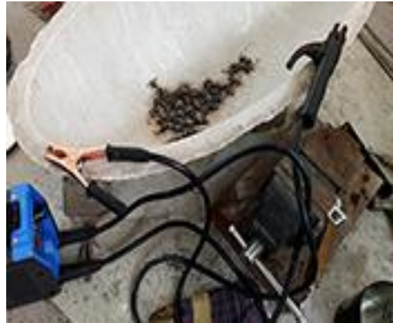
3.b) Proses pengelasan dimulai dari tengah, sedikit demi sedikit menyebar ke tepi luar (dokumen pribadi 2020).