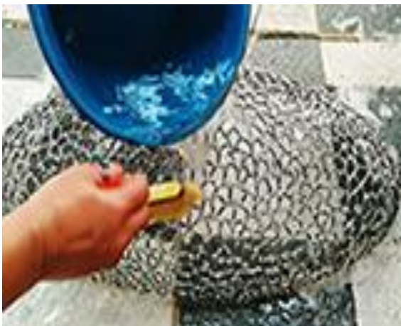
4.2.b) Selanjutnya gel pembersih, dibersihkan dengan air secara berulang hingga bersih keseluruhan (dokumen pribadi, 2020).