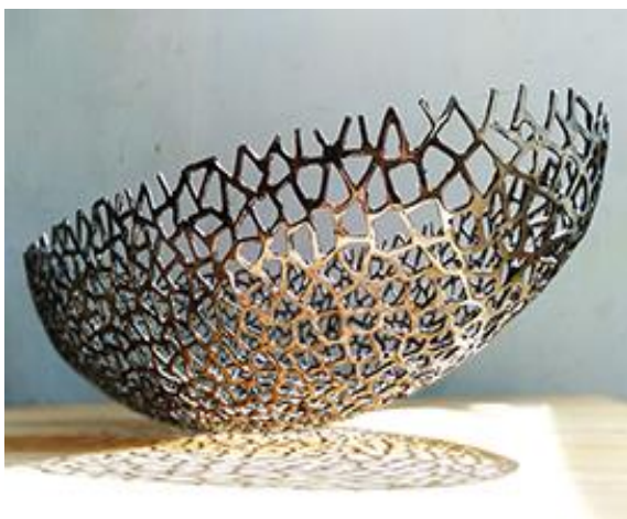
Karya oval dengan posisi menengadiah (dokumen pribadi, 2020)

Hasil riset teknik las busur ini telah berhasil menciptakan satu karya 3 dimensi berbentuk oval dengan permukaan lengkung dari bahan as stainless steel .