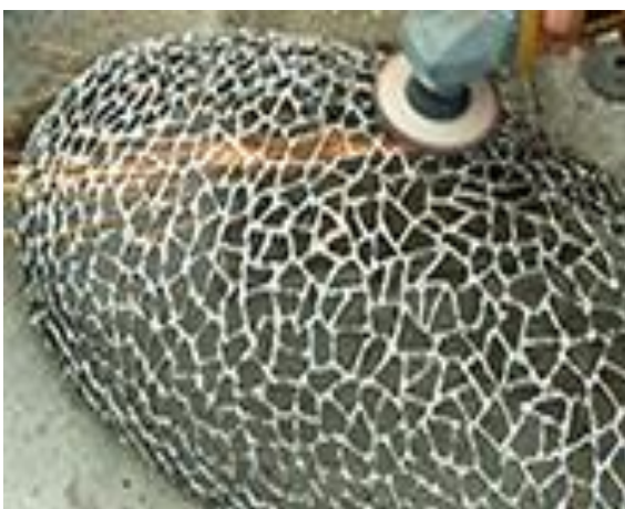
4.2.c) Memapras permukaan oval dengan mata gerinda asah dan mata gerinda amplas susun.