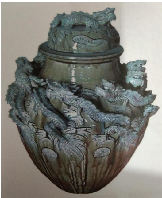
Gambar 5. Keramik Singkawang, Naga sembilan Motif Naga sangat kuat t ekstur kuat

Di antara karya-karya yang sebanding dengan itu adalah karya keramik zaman Majapahit yang memiliki nilai sakral sangat tinggi. Ada lagi keramik dari Singkawang, yaitu keramik-keramik yang dipersembahkan untuk kebutuhan yang berhubungan dengan kematian, seperti guci untuk menyimpan tulang-belulang leluhur atau menyimpan abu jenazah. Guci Singkawang ini memiliki ornamen yang teksturnya sangat menonjol sekali, misalnya guci bermotifkan Naga 9, Naga 7, dan Naga 4.