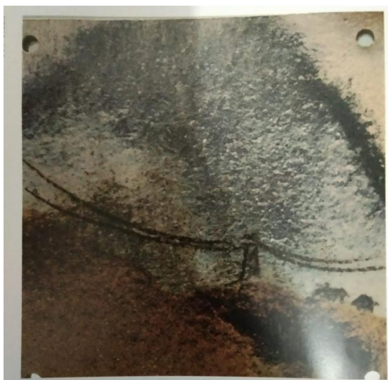
Gambar 6. Keramik dengan tekstur semu Judul: Norwegian mountains landscape 1 Oleh : Hwang Jeng- Daw. 3,9x3,9x 3/8 inci

Karya kedua keramik dari mancanegara ini merupakan tile yang memiliki tekstur semu, akan tetapi memiliki nuansa dan interpretasi yang luas. Tekstur semu memiliki banyak kelonggaran bagi audiens untuk berselancar menikmati bagaimana image atau kesan dan imajinasi yang sungguh kaya, inilah kelebihan dari permainan glasir yang banyak cara bisa menghantarkan pada imaji yang paling abstrak. Gambar ini bagian dari kumpulan kreativitas wujud tile atau tegel yang dibuat oleh para perupa keramik di seluruh dunia (500 Tiles. Lark Book, New York, 2006). Glasir juga menjadi poin utama dalam finishing keramik, di samping melindungi bodi glasir bagaikan baju atau casings dari bangunan keramik, sekecil apapun keramik itu, glasir mengambil peranan penting akan berhasil tidaknya sebuah benda keramik.