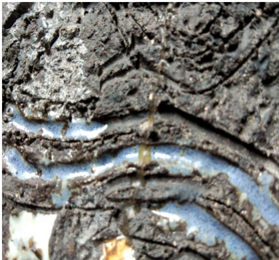
Gambar 3. Tekstur pada tanah hitam Keramik : Noor Sudiya. Thn 2016

Tekstur adalah nilai raba dari permukaan bod keramik. Tekstur atau barik yang menempel pada permukaan benda keramik akan menambah nilai keramik tersebut dan menjadi bermakna lebih. Potensi keramik sangat luas dalam menyuguhkan beraneka ragam tekstur, bahkan tak terhingga.