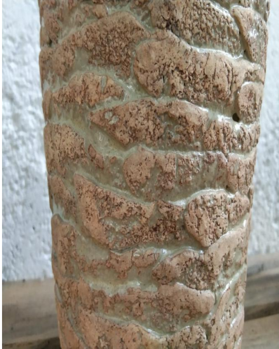
Gambar 7. Tekstur keramik bergaris dan kasar Bagian Keramik; Noor Sudiyti, Thn 2020.