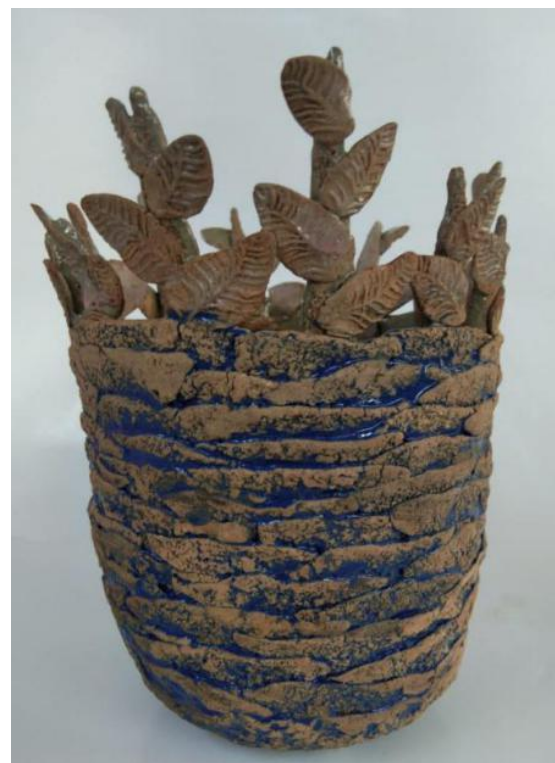
Gambar 2. 'Hybrit' Keramik Oleh : Noor Sudiyati Thn 2020

Kedua Keramik di atas buatan Noor Sudiyati (penulis) tidak mengacu kepada benda-benda yang sudah ada dalam dunia nyata ini. Dalam arti tidak mencontoh suatu benda