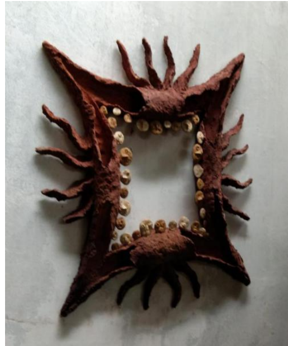
Gambar 1. 'Empat arah Mata Angin' Keramik oleh : Noor Sudiyati Thn 2004.

Wujud keramik memiliki daya pikat bagi audiens, baik dari glasir dengan pewarnaan terapan teknik yang berjalan secara improvisasi, maupun bentuk yang kadang tidak mengacu pada apapun di dunia nyata. Bentuk keramik kadang hadir tidak mewakili bentuk-bentuk yang sudah ada, namun pada kenyataannya: merepresentasikan apa yang ada dalam dunia ide dari pembuatnya, dalam hal ini keramik merupakan metaphor yang dihadirkan tanpa kompromi rencana sebelumnya. Bentuk yang tidak lazim justru mencuri perhatian kita apalagi sepanjang bentuk-bentuk tersebut belum pernah ada dalam karya sebelumnya. Estetika keramik hadir begitu saja mengalir oleh tulusnya pengabdian mencipta, tidak ada tendensi apapun, kecuali ingin mewujudkan sesuatu yang ada dari dunia ide.