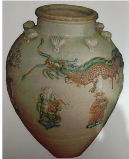
Gambar 6. Keramik Singkawang, Motif Naga dewa Motif Dewa, Naga, tekstur tidak begitu kuat