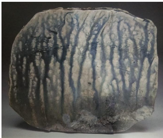
Gambar 5. Keramik dengan Tekstur semu glasir Judul : Wire-cut Slab, bakar kayu, glasir garam Oleh John Heaney, Thn 2006 . 9x10,5x 0,75 Inchi

(bukan tekstur asli ), akan juga memberikan image karena ada tekstur maya atau tekstur semu yang dapat dihadirkan oleh warna, terutama warna yang didapat dari penggunaan glasir. Dalam hal ini, nilai rabanya akan menjadi imajinasi saja, yang artinya tidak bisa dirasakan dengan sentuhan tangan atau kulit kita, hanya ada dalam tangkapan rasa saja. Oleh karenanya, nilai raba yang senyatanya adalah apabila permukaan keramik benar-benar memiliki rabaan, baik kasar, halus, setengah kasar, bertumpang tindihnya garis dalam permukaan, dan lain sebagainya.