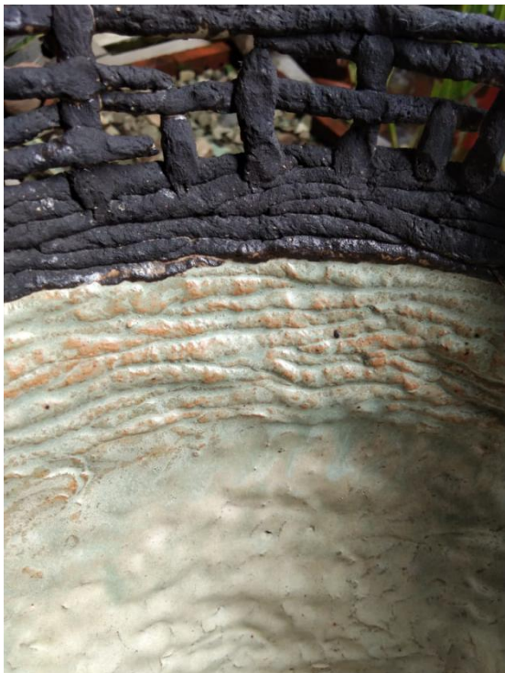
Gmb.8. tiga macam tekstur keramik Bagian Keramik Noor Sudiyti Thn 2016.

Gambar Keramik di atas adalah bagian batang dari keramik yang memiliki tekstur seakan ada garisnya dan bertumpuk-tumpuk. Garis