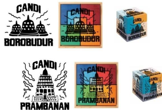
Gambar 4. Situs Warisan Budaya yang Ada di Indonesia