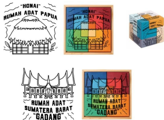
Gambar 3. Desain Beberapa Rumah Adat yang Ada di Indonesia

Desain yang kami buat berjumlah 25 desain yang semuanya menggambarkan kesenian dan kebudayaan yang ada di Indonesia. Berikut beberapa desain produk “Puzzle Sablon Edukatif Artistik, dan Berbudaya