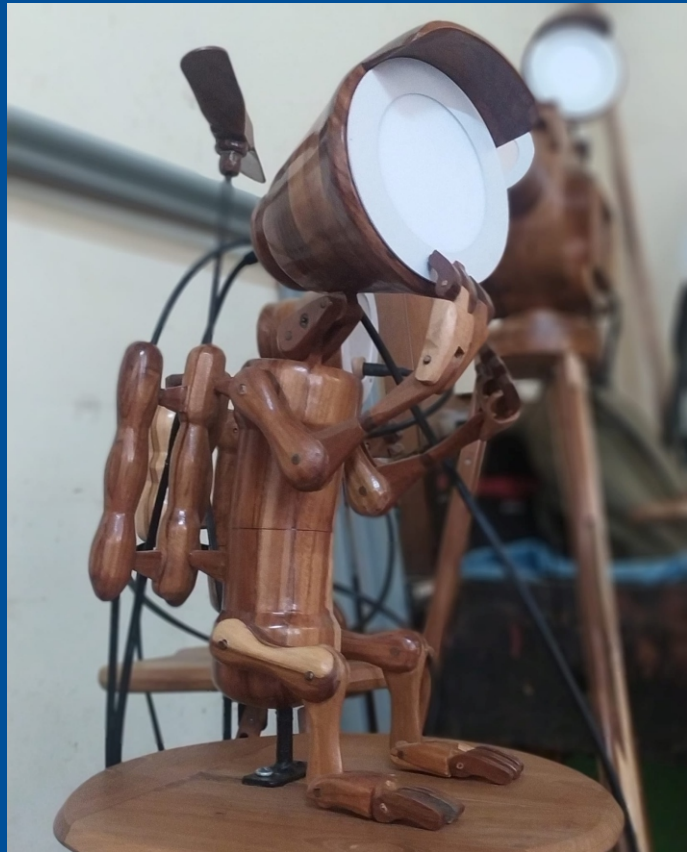
Bentuk Robot Lampu dalam Seni Kriya Kayu Ranu Wijaya 2022