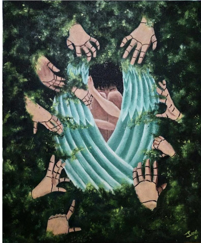
Gambar 4. 1 Sarah Aulia Rudiana, Drapetomania , 2022 cat akrilik pada kanvas, 60x50cm

Kondisi ingin melarikan diri dari suatu hal. Si gadis yang merasa digerogoti oleh banyak tangan mannequin yang berusaha menyakitinya membuat dia merasa ingin melarikan diri dari tempat tersebut bahkan orang yang ada di sekitarnya. Si gadis begitu sulit menangani rasa kecemasan.