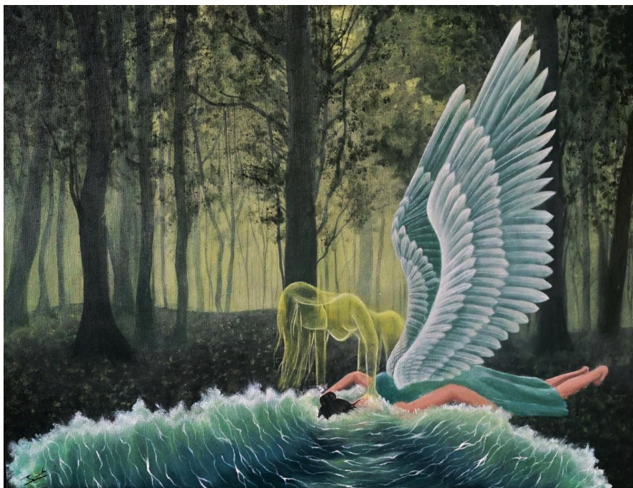
fig 3. Sarah Aulia Rudiana, Metanoia , 2022 cat akrilik pada kanvas, 60x80cm

Di dalam karya ini terdapat karakter seperti roh berwarna kuning yang dimaksudkan sebagai rasa ketakutan berlebih akan sesuatu. Hal ini didukung dengan warna psikologi kuning yang melambangkan keraguan atau tidak stabil. Keraguan yang ada di kepala si gadis mulai memberontak dan ingin melawan si gadis.