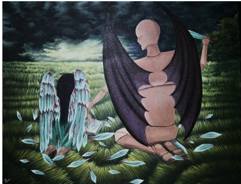
fig 1. Sarah Aulia Rudiana, the abusive adult , 2022 cat akrilik pada kanvas, 90x70cm

Dalam karya ini menonjolkan suasana mencekam dan perbandingan bentuk tubuh yang berbeda antara mannequin dan gadis kecil. Adanya buku di depan gadis kecil mengisyaratkan bahwa gadis kecil belajar dengan bantuan mannequin besar tersebut. Terdapatnya sayap karakter anak kecil tersebut dengan sayap yang terluka memvisualisasikan bagaimana mannequin itu mencoba mendidik gadis kecil dengan kekerasan, mencabut satu persatu sayap yang dapat membuatnya jauh terbang tinggi.