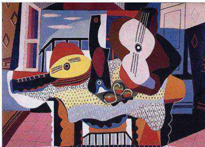
Gambar 3: Karya Picasso, "Still Life with Mandolin" 1924. Oil on canvas, 19 x 37" Modern Of Art Museum.