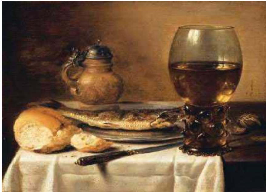
Gambar 1: Karya Pieter Claesz, Dutch, 1597–1660. Oil on Canvas. Breakfast Piece with Stoneware Jug, Wine Glass, Herring, and Bread, size 60cm x 84 cm, Museum of Fine Arts, Boston.