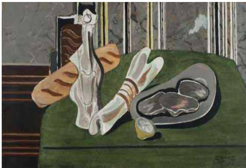
Gambar 2: Karya Georges Braque, Still Life with Oysters , 1937. Oil on canvas, 21 1/8 x 36 3/4" , Mildred Lane Kemper Art Museum, Washington.