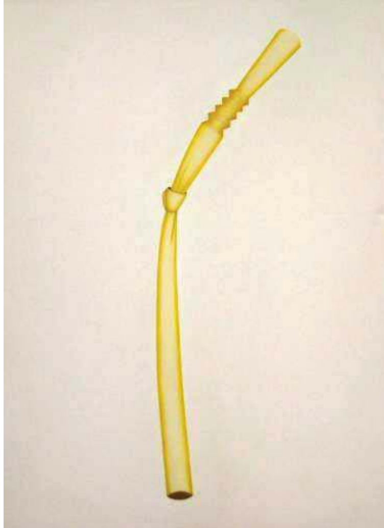
Gambar 5; My Pleasure , Akrilik di atas kanvas, 2016 100cm x 130cm.

Karya ini dibuat berdasarkan pengalaman dan pengamatan penulis terhadap persoalan budaya konsumsi yang akhir-akhir ini menjadi masif sebagai konsekuensi dari keberlimpahan informasi, infrastruktur belanja, mesin ATM, iklan, polarisasi nilai serta proses komunikasi yang memungkinkan terjadinya distorsi gaya hidup pada kecenderungan bentuk trend perilaku, termasuk di dalamnya adalah pola dan cara mengkonsumsi.