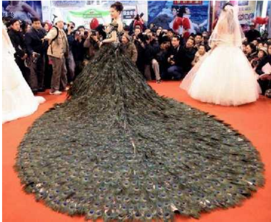
Gambar 1. Contoh busana untuk fashion show