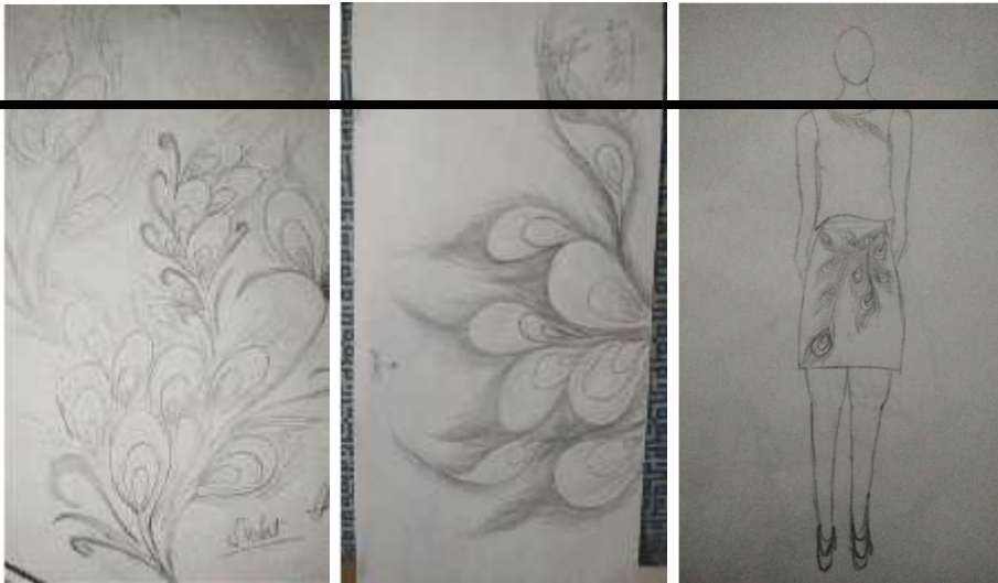
Gambar 3. Beberapa sketsa terpilih