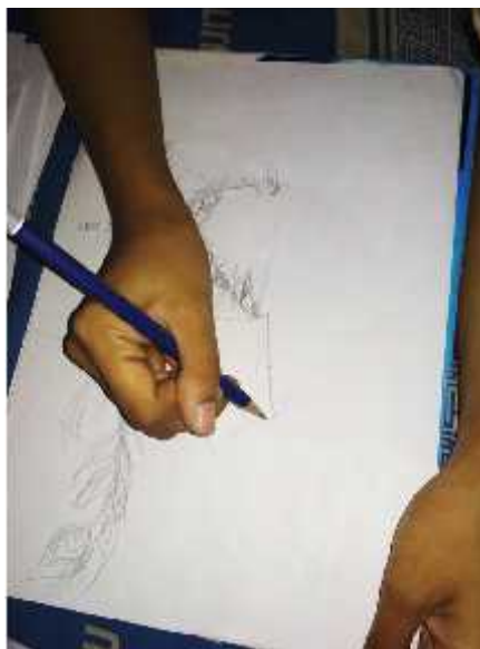
Gambar 4. Proses pembuatan sketsa