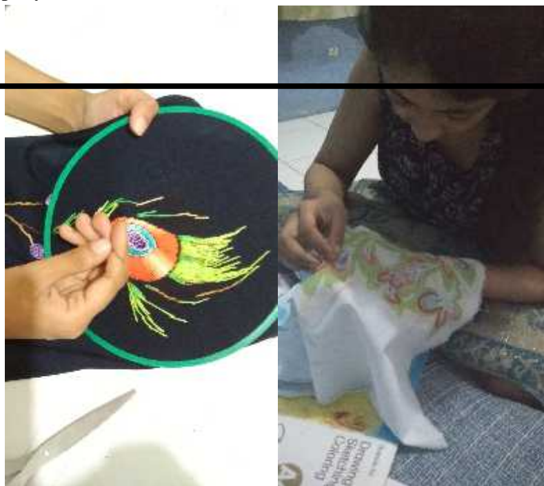
Gambar 6. Proses penyulaman busana