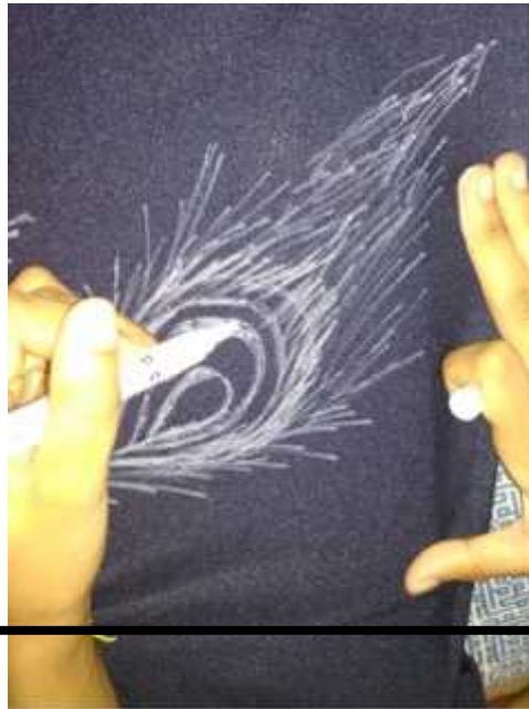
Gambar 5. Pengaplikasian sketsa pada bahan karya