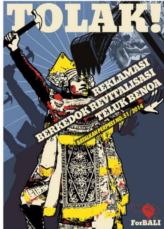
Gambar. 3. "Tolak Reklamasi", 2015 Sumber https://www.posteraksi.org

Dalam ilustrasi penari Bali pria yang mengenakan kostum penari Bali dan