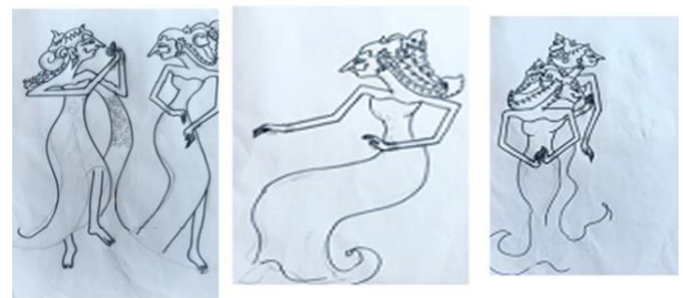
Gambar 4 Sketsa Karya