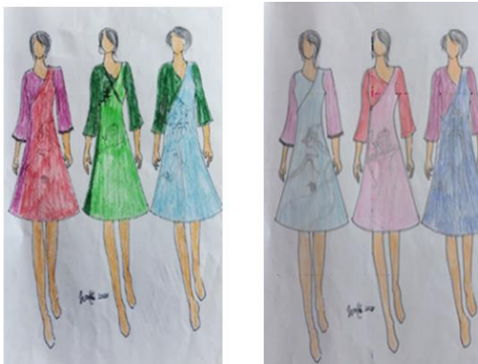
Gambar 6 Sketsa Karya dengan warna