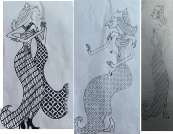
Gambar 5 Sketsa Karya Sketsa busana dan Alternatif warna yang diterapkan dalam busana