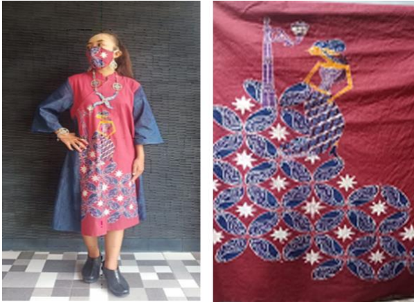
Judul : "Keanggunan Dewi Drupadi"

Karya kedua batik tulis untuk busana casual wanita ini berjudul "Keanggunan Dewi Drupadi". Batik tulis kain ini dikerjakan dengan penempatan motif Dewi Drupadi yang diwujudkan dalam figur wanita saat ini dengan memakai sepatu di bagian tengah, di bawahnya ada motif kawung yang dari stilasi sumping waderan. Bagian atas samping dengan motif lampu jogja artinya memberi perwujudan karya sebagai bentuk gambaran saat ini di Yogyakarta, sedangkan bagian tengah dengan motif Latar pada bagian atas dan bawah figur wayang drupadi dipenuhi dengan isen-isen ukel, sedangkan pada bagian tengah dengan motif daun-daun. Perwujudan pada motif dikerjakan dengan teknik batik tulis. Pewarnaan pada motif Dewi Drupadi dikerjakan dengan teknik colet dan celup dengan menggunakan pewarna indigosol dan naptol. Warna-warna indigosol yang digunakan dengan warna merah, coklat kekuningan, dan biru, sedangkan warna indigosol yang digunakan dengan warna kuning dan hijau. Pewarnaan pada latar dan tumpal dengan teknik celup dikerjakan menggunakan pewarna indigosol yang berwarna hijau.