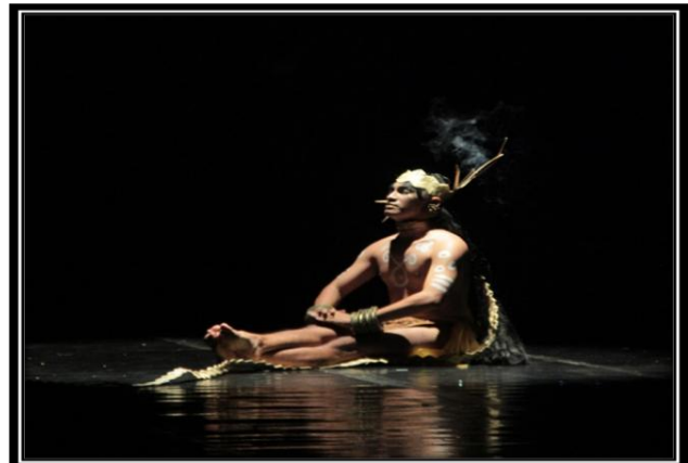
Gambar 6: Pose penari dalam posisi duduk untuk mengawali fragmen empat.

properti diikatkan menutup mata sebagai maksud sampainya wadian pada tahap in trance . Diakhir fragmen seluruh rambut dibuat seperti saling menjalin satu sama lain dan hadirnya sosok penari yang menggunakan busana masa kini dengan mengenakan gelang hiyang di kedua tangannya di tengah-tengah jalinan rambut tersebut. Hal ini dimaksudkan sebagai ungkapan Wadian liminal di masa sekarang yang tetap terikat dalam tradisinya.