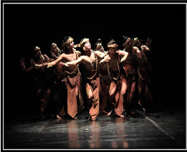
Gambar 8: Pose gerak ngelepai pada fragmen empat.