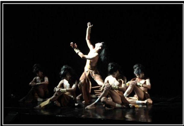
Gambar 5: Penari dalam posisi level atas merupakan penggambaran Ineh Payung Gunting yang berdoa pada Tuhan. (foto: Ari Kusuma, 2017, di proscenium stage , ISI Yogyakarta)

properti diikatkan menutup mata sebagai maksud sampainya wadian pada tahap in trance . Diakhir fragmen seluruh rambut dibuat seperti saling menjalin satu sama lain dan hadirnya sosok penari yang menggunakan busana masa kini dengan mengenakan gelang hiyang di kedua tangannya di tengah-tengah jalinan rambut tersebut. Hal ini dimaksudkan sebagai ungkapan Wadian liminal di masa sekarang yang tetap terikat dalam tradisinya.