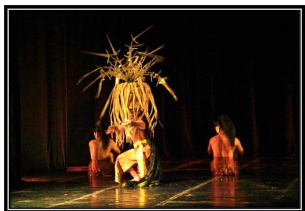
Gambar 2: Penari putri sebagai simbol ruh Wadian dengan headpiece menyerupai Tihang Penangkur . (foto: Ari Kusuma, 2017, di proscenium stage , ISI Yogyakarta)