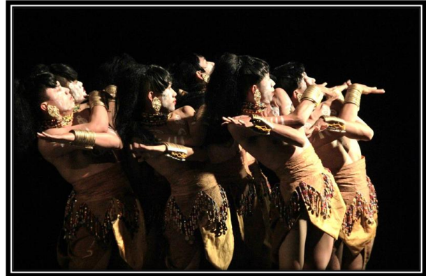
Gambar 3: Pose motif ular meliuk pada fragmen dua.

Pertarungan antara ular tedung, burung elang, dan macan dahan diyakini sebagai esensi gerak tari Wadian Dadas . Walaupun fragmen ini mengisahkan pertarungan ketiga binatang, tetapi pertarungan itu tidak digambarkan secara representasi. Hal ini dikarenakan analisa penata, bahwa pertarungan binatang ini hanyalah sebuah paradoks belaka, dalam artian kehadiran ketiga binatang ini berkaitan dengan kepercayaan adanya dunia atas, dunia bawah, dan dunia tengah. Berangkat dari pemahaman tersebut pertarungan itu divisualkan dengan tanya-jawab gerak dan juga pengolahan terhadap aspek ruang gerak yaitu tinggi rendahnya level. Materi geraknya sendiri merupakan hasil pencarian terhadap karakteristik tiga binatang tersebut. Ular tedung menghasilkan gerak-gerak yang meliuk. Burung elang menghasilkan gerak yang bervolume luas diilhami dari sayapnya. Macan dahan menghasilkan lompatan-lompatan. Ketiga binatang itu juga dituangkan dalam sikap tangan seperti mencengkram, seperti kepala ular tedung.