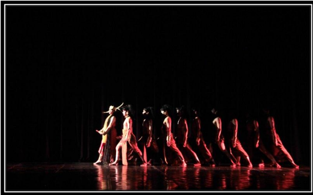
Gambar 4: Pose gerak meyembah pada langit dengan diikuti in nya penari putri. (foto: Ari Kusuma, 2017, di proscenium stage , ISI Yogyakarta)