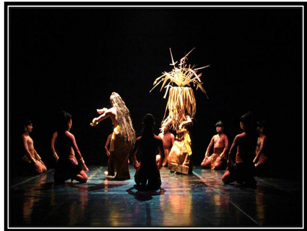
Gambar 1: Penari membentuk pola melingkar sebagai wujud menyatukan perhatian pada ritual. (foto: Ari Kusuma, 2017, di proscenium stage , ISI Yogyakarta)

penggambaran masuknya ilmu Wadian ke dalam tubuh yang dipilihnya. Di dalam pola lingkaran kedua penari menari bersama secara mirroring dan sesekali bersahut-sahutan bunyi gelang, sampai sepenuhnya sosok penari wanita terkesan menyatu dengan penari laki-laki dalam satu garis lurus. Sebagai simbol telah masuk sepenuhnya ilmu Wadian ke dalam tubuh yang baru.