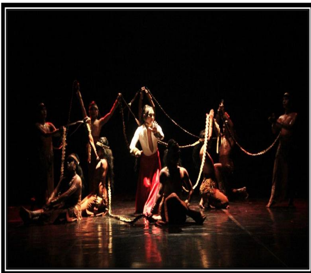
Gambar 9: Rambut saling terjalin dengan satu penari yang mengenakan kostum berbeda sebagai penggambaran Wadian di masa kini yang tetap terikat tradisi.

(foto: Ari Kusuma, 2017, di proscenium stage , ISI Yogyakarta)