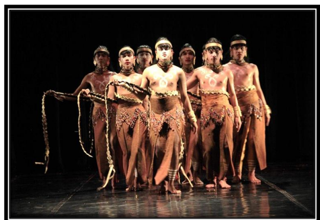
Gambar 7: Penari menggunakan properti rambut pada fragmen tiga. (foto: Ari Kusuma, 2017, di proscenium stage , ISI Yogyakarta)

Fragmen keempat menghadirkan suasana ritual yang dipimpin seorang wadian liminal . Penata menggunakan properti berupa rambut yang dibungkus dengan daun lontar berbentuk kelabang. Selain sebagai simbol tolak bala rambut ini diharapkan mampu memunculkan sisi feminin pada diri penari. Pada fragmen ini juga