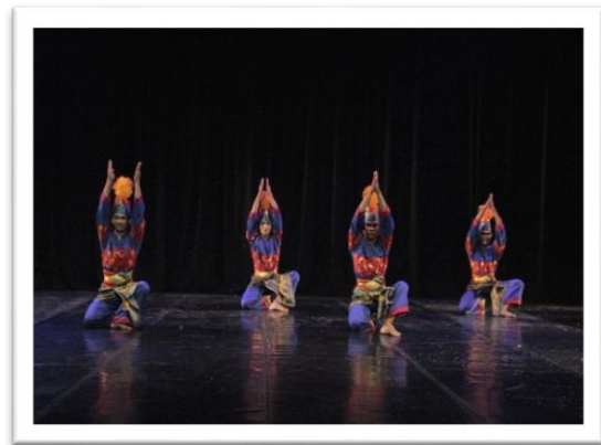
Gambar 6: Pose dalam motif gerak salam pada adegan 1 (04 Juni 2018, Stage Jurusan Tari ISI Yogyakarta)