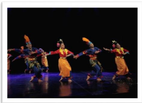
Gambar 9: Pose dalam motif gerak dayung (04 Juni 2018, Stage Jurusan Tari ISI Yogyakarta)