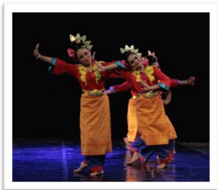
Gambar 8: Pose dalam motif gerak Lotio pada adegan 1 (Foto: Ari Kusuma, 04 Juni 2018, Stage Jurusan Tari ISI Yogyakarta)