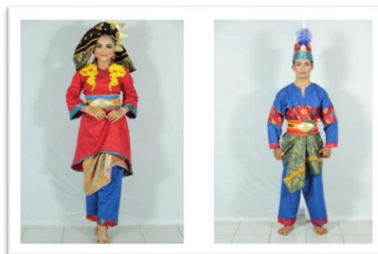
Gambar 1: Desain busana penari laki-laki dan perempuan

Riasan kepala pada laki-laki, menggunakan songkok yang dibuat senada dengan bahan songket yang digunakan pada baju. Pemilihan warna yakni kain yang berwarna merah dengan perpaduan warna biru. Warna merah dipilih melambangkan semangat dan persaudaraan sedangkan warna biru diambil dari salah satu elemen dalam prosesi Balimau Kasai yakni air.