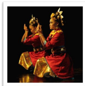
Gambar 11: Pose dalam motif gerak basuh pada adegan 2 (Foto: Ari Kusuma, 04 Juni 2018, Stage Jurusan Tari ISI Yogyakarta)