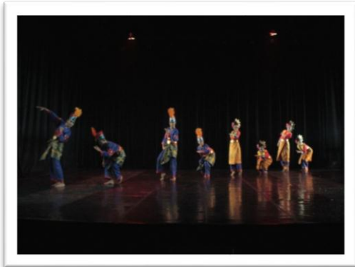
Gambar 12: Pose dalam motif gerak pacu jalur pada adegan 2 (Foto: Ari Kusuma, 04 Juni 2018, Stage Jurusan Tari ISI Yogyakarta)