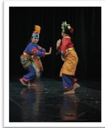
Gambar 10: Pose dalam motif gerak lingkar randai (Foto: Ari Kusuma, 04 Juni 2018, Stage Jurusan Tari ISI Yogyakarta)