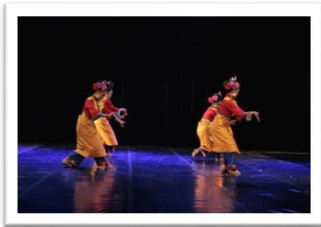
Gambar 7: Pose dalam motif gerak Racik Ramu pada adegan 1 (Foto: Ari Kusuma, 04 Juni 2018, Stage Jurusan Tari ISI Yogyakarta)