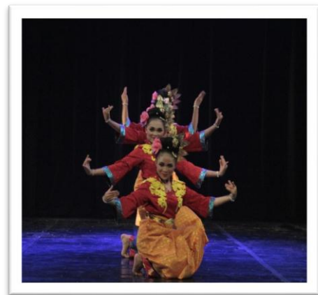
Gambar 2: Simbolisasi prosesi tepuk tepung tawar dalam adegan introduksi