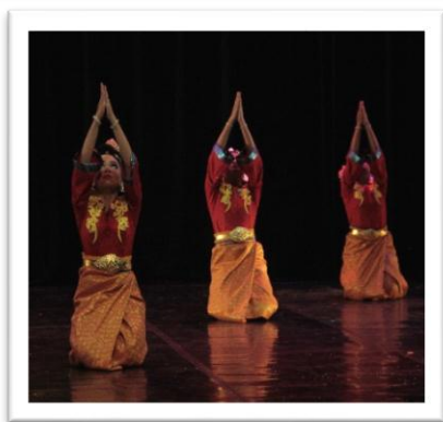
Gambar 13: Pose dalam motif gerak berdoa pada adegan 3 (Foto: Ari Kusuma, 04 Juni 2018, Stage Jurusan Tari ISI Yogyakarta)