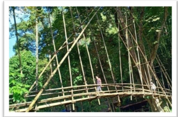
Gambar 1: Rawayan yang Menghubungkan Kampung Gajeboh dan Kampung Cicakal Muara.

Sumber: Dokumentasi Dwi Risnawati Ayuningsih, tanggal 30 Maret 2019.