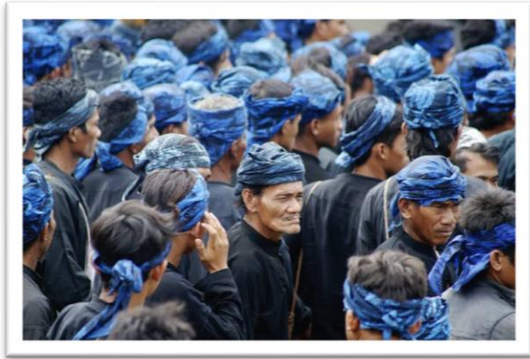
Gambar 5: Masyarakat Suku Baduy Luar (Berbaju Hitam Dengan Ikat Kepala Berwarna Biru).