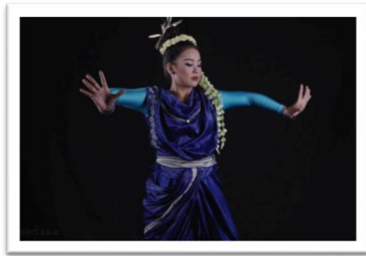
Gambar 4: Tari Rawayan pada Motif Gerak Teundeut Jagat dalam Frase Teundeut Jagat .

Teundeut Jagat merupakan bahasa Sunda yang berarti menekan semesta. Gugum Gumbira menganalogikan menekan semesta dengan membuat suatu keputusan dengan segala pertimbangan untuk sebuah kebaikan. Setiap manusia dalam menjalani kehidupannya pasti selalu dihadapkan dengan berbagai pilihan. Terkadang manusia menjadi bimbang untuk mengambil keputusan mana yang paling baik. Manusia memerlukan tekad dan keyakinan yang kuat untuk percaya mengambil sebuah keputusan. Kebulatan tekad dan keyakinan bahwa keputusan yang dipilih itu tepat akan membawa kita pada kebaikan itu sendiri.