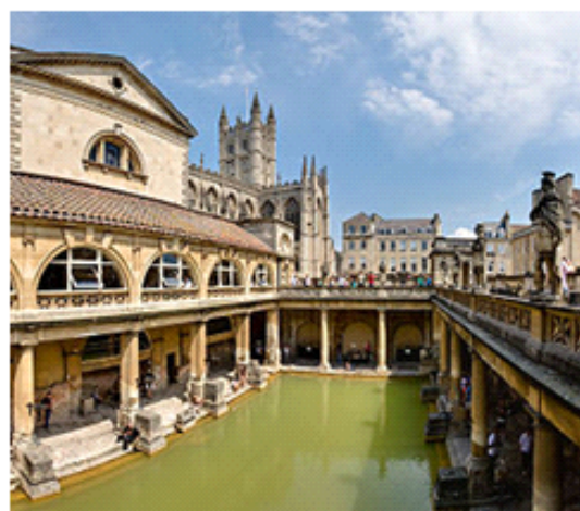
Gambar 2. Aquaduct dan Thermae.