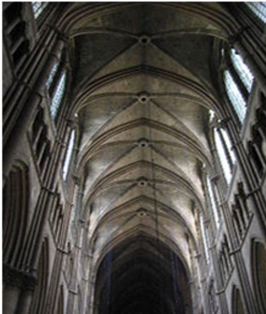
Gambar 3. Clerestory Cathedral Rheims

Kemajuan Romawi di bidang interior dan arsitektur selain dapat dilihat dari kemegahan dan kemewahan bangunan-bangunannya juga dari sistem peratapannya yang sangat hebat, merupakan kombinasi antara lengkung sejati ( true vault ) dan lengkung silang ( cross barrel vault ). Struktur cross vault yang dimulai di jaman Romawi berbuah luar biasa di jaman Gotik. Karena kehebatan konstruksinya, gereja Gotik berani membuka clerestory berdinding kaca