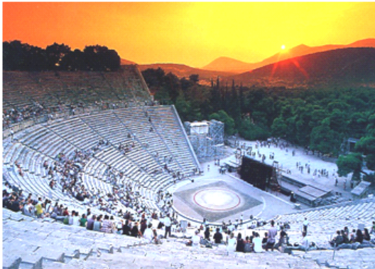
Gambar 1. Teater Terbuka Epidauros

piramida menggambarkan bahwa bangsa Mesir pada saat itu telah memiliki kemampuan teknik yang sangat hebat.