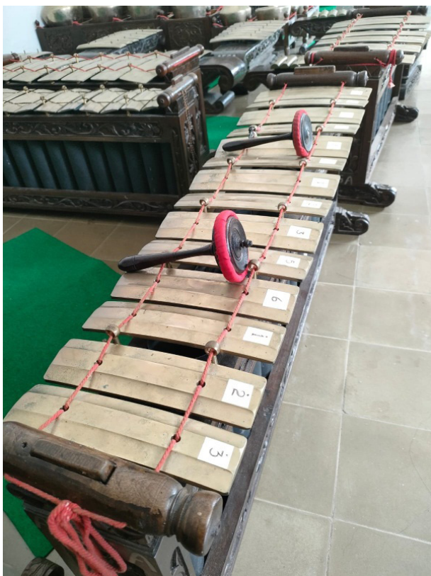
Gambar 4: Instrumen gender .

Sarana ini digunakan untuk memperjelas dan dapat dijadikan sebagai acuan untuk mengetahui jalannya sajian tembang macapat. Berbagai sarana tersebut sangat mendukung untuk jalannya proses pembelajaran tembang macapat. Melalui penggunaan sarana pembelajaran yang baik akan memungkinkan mahasiswa untuk memberikan umpan balik dan mendorong mahasiswa untuk mempraktikkan praktik secara baik dan benar. Berikut ini contoh gambar sarana pembelajaran yang digunakan pada proses pembelajaran mata kuliah tembang macapat.