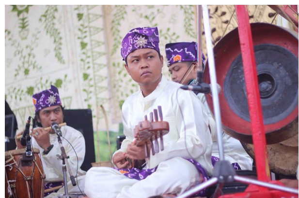
Gambar 5. Instrumen suling dan Panting dalam kelompok Ading Bastari.

Pada tahun 1985, musik Panting disajikan dalam bentuk yang terbilang sederhana, terutama dalam segi peralatan, kostum, dan jumlah lagu yang dibawakan. Semakin meningkatnya pendidikan di kalangan