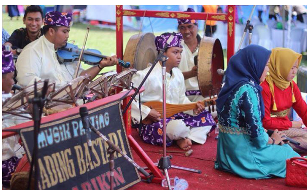
Gambar 4. Instrumen Perkusi tambahan, Biola, Panting , Agung-Kampul , dan Penyanyi, dalam kelompok Ading Bastari.

Pada tahun 1985, musik Panting disajikan dalam bentuk yang terbilang sederhana, terutama dalam segi peralatan, kostum, dan jumlah lagu yang dibawakan. Semakin meningkatnya pendidikan di kalangan masyarakat menyebabkan referensi mereka terkait dunia hiburan semakin bertambah, sehingga tuntutan mereka terhadap sarana hiburan pun semakin bertambah pula. Ini