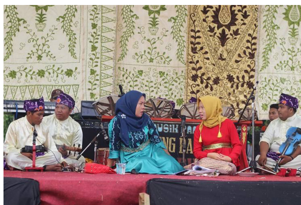
Gambar 3. Kelompok Musik Panting Ading Bastari dari Desa Barikin.

Instrumen panting pada awalnya merupakan perangkat yang digunakan untuk tujuan hiburan pribadi. Namun, dalam perjalanannya, fungsi panting berkembang menjadi hiburan masyarakat. Awalnya panting digunakan untuk mengiringi kesenian japin gunung di kalangan masyarakat pedalaman Kalimantan Selatan. Musik japin gunung seringkali disajikan secara mandiri, yakni dalam bentuk pertunjukan musik saja tanpa tarian,