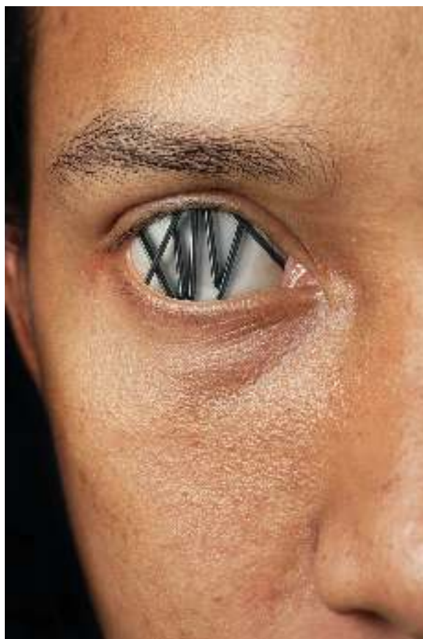
Obsesi Digital print on photopaper 40 cm x 60 cm 2018

Diri merasa dihadapkan pada kemustahilan untuk membahagiakan antara orang tua atau kekasihnya. Hal tersebut terjadi karena diri terlalu memandang permasalahan antara kedua keinginannya dan tidak segera memilih untuk mewujudkan salah satunya. Dalam karya ini, permasalahan tersebut digambarkan melalui paku-paku yang menghalangi pandangan mata.