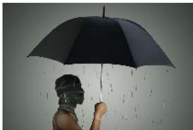
Obsessive Compulsive Digital print on photopaper 40 cm x 60 cm 2018

Diri yang menjadi sasaran target menjadi terkejut karena sebuah paku bisa menancap sangat kuat jika momentumnya dibantu oleh kecepatan. Karya ini menampilkan sosok diri yang ketakutan, sadar karena hal-hal buruk yang diasosiasikan melalui paku-paku tersebut. Hal buruk akan menciderai jika diri tidak siap dengan ilmu pengetahuan dan seluruh pengalaman yang dimiliki.