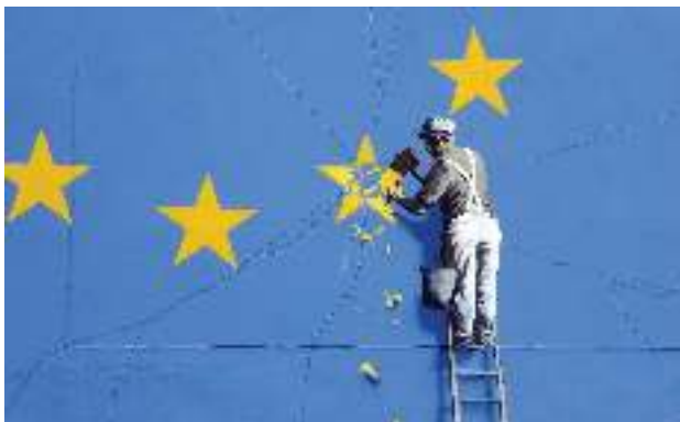
Banksy, 2017

Karya Banksy di atas merupakan karya mural Banksy di gedung daerah kota Dover, Inggris bagian selatan. Karya tersebut dibuat ketika United Kingdom diputuskan untuk keluar dari European Union , Mei 2017. Dalam karya Banksy, terdapat gambar bendera EU yang berisi 12 bintang melingkar, melambangkan kesatuan EU. Namun di ujung bawah bendera terdapat gambar stensil seorang