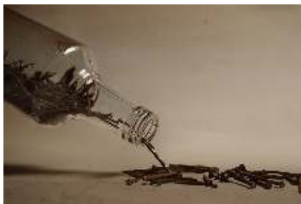
Uneg-uneg Digital print on photopaper 60 cm x 40 cm 2018

Setiap orang memiliki permasalahan hidupnya masing-masing. Permasalahan yang ditimbun dalam pikiran dapat menimbulkan ketidakseimbangan hidup. Ketidakseimbangan tersebut dapat merugikan diri sendiri maupun orang lain. Jika permasalahan terus dipikirkan dan tidak kunjung diselesaikan, maka diri akan menjadi depresi. Jika diri merasa belum mampu menyelesaikan masalahnya, diri setaknya menumpahkan isi pikirannya dengan bercerita kepada orang lain. Menumpahkan isi pikiran dapat mengurangi beban pikiran dan membuka kemungkinan untuk mendapat saran bahkan solusi dari pendengarnya.