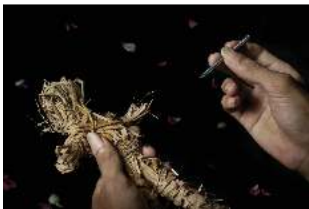
Habis Akal Digital print on photopaper 60 cm x 40 cm 2018

'Habis Akal' ialah sebuah situasi di mana diri sudah merasa terhimpit dan mulai tidak tahu arah. Tindakan yang menyusul setelah kehabisan akal kadang tidak terduga, dan seringnya merugikan. Habis akal juga bisa diartikan sebagai ungkapan ketika melihat sesuatu hal negatif yang sulit dibahasakan dengan kata-kata. Karya ini menggambarkan kegiatan santet .