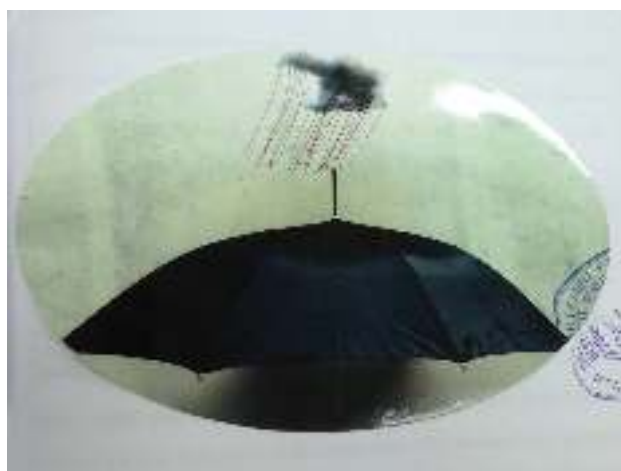
BM -Ombrophobia- N oleh Fachrozi Amri, 2009 Dokumentasi pribadi dari tulisan Karya Tugas Akhir "Objek Benang Merah sebagai Ide Penciptaan Fotografi Seni"

Selain itu juga telah ada karya foto dengan mengungkap narasi tentang fenomena lingkungan sekitar dari perspektif subjektif fotografer, karya tersebut ialah karya foto ciptaan Amir Fachrozi.