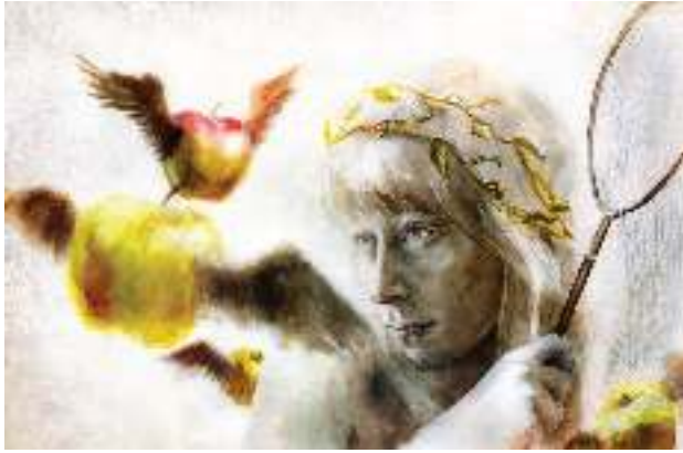
Eve oleh Beatriz Martin Vidal, 2013