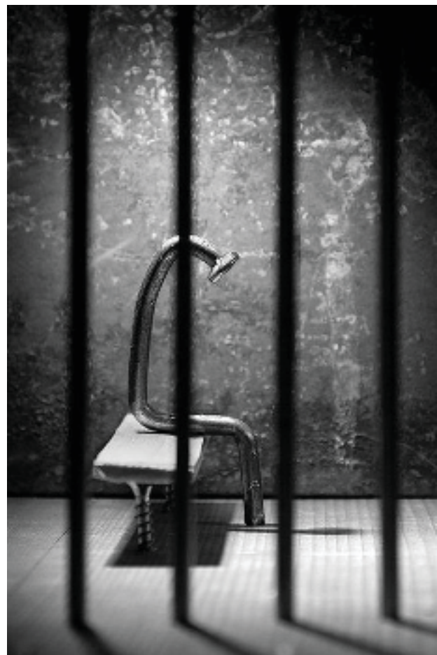
Nail Art series 1 oleh Vlad Artosov, 2009 Diambil dari laman https://www.webdesignerdepot.com/2011/06/impressive-nails-life-series-by-vlad-artazov/

Karya di bawah ini adalah karya Nail Art yang dibuat oleh Vlad Artosov. Vlad Artosov adalah fotografer asal negara Ceko. Karya di atas merupakan karya seri fotonya yang berjudul Nail Art series dan dibuat pada tahun 2009. Perbedaan karya Vlad Artosov dengan karya foto yang akan dibuat adalah penggunaan objek paku sebagai objek utama. Paku yang akan ditampilkan di dalam karya fotografi di sini bukan sebagai seorang manusia, namun sebagai objek yang dinarasikan secara simbolis bersama benda temuan lain untuk merepresentasikan gagasan tentang diri dengan bertolak dari refleksi pribadi terhadap lingkungannya.