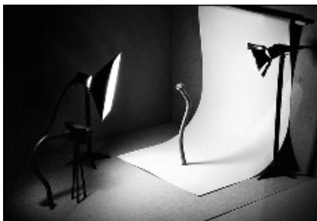
Nail Art series 2 oleh Vlad Artosov, 2009