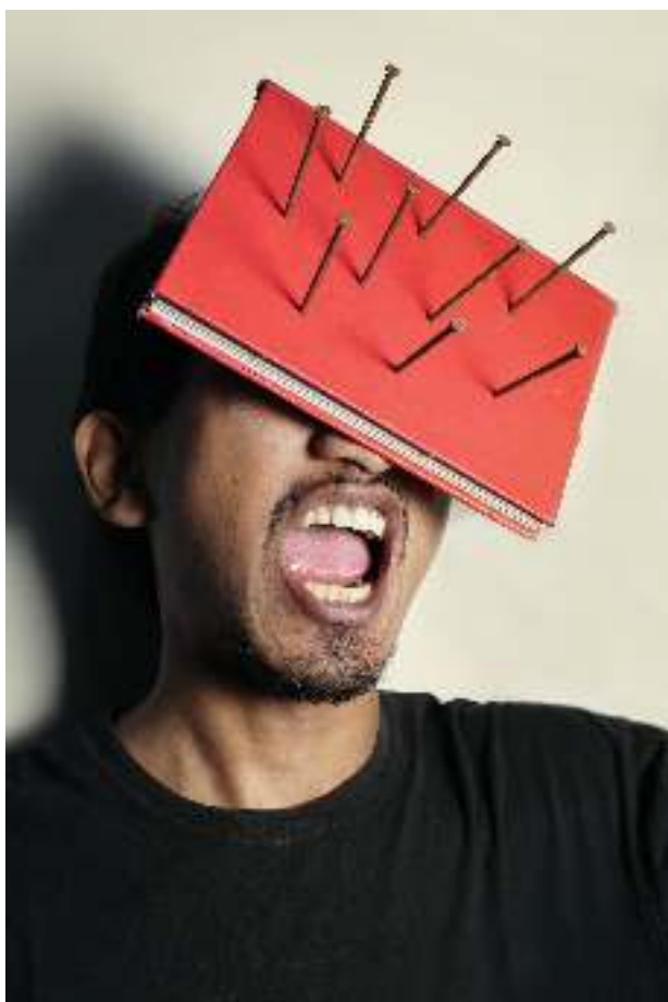
Harga Mati Digital print on photopaper 40 cm x 60 cm 2018

“Aku sangat takut, diam tak membantuku, mataku tertutup, mendadak aku sangat terkejut, paku-paku neyeng menyerangku, tepat di depan kepalaku, menyerang mataku, ahh aku buta. Sekejap kepalaku dingin, Tapi... beruntunglah aku, aku tahu ada sesuatu yang melindungiku, tepat di depan mataku, itu bukuku.”