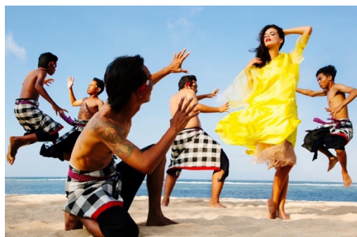
Gambar 2. Salah satu karya foto editorial “Kembali ke Bali”