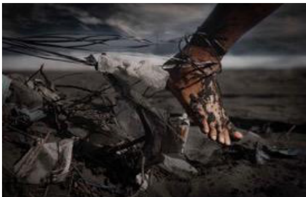
Karya 3 Langkah yang Tertahan 2019 40cm x 60cm Cetak digital pada kertas doff

Dalam penciptaan karya foto visual ini dihadirkan dua subjek, yaitu manusia sebagai subjek utama dan sampah sebagai subjek pendukung. Visual tersebut merupakan hasil pengamatan yang merupakan gambaran dari hewan yang terkena dampak sampah plastik. Pada karya empat nampak manusia yang tenggelam karena plastik yang menyangkut pada kakinya. Saat ini laut banyak yang dipenuhi dengan sampah plastik. Sampah-sampah plastik mengganggu kehidupan hewan di laut karena mereka menjadi susah untuk berenang dan dapat mengancam nyawa.