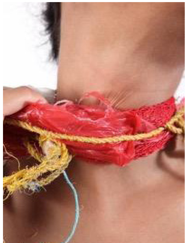
Gambar 2. Entanglement, Jeremy Carroll.