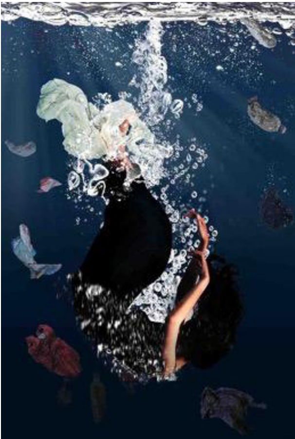
Karya 4 Drowning 2019 40cm x 60cm Cetak digital pada kertas doff

Dengan adanya karya ini diharapkan manusia juga dapat merasakan seperti apa yang dirasakan hewan tersebut. Dengan karya ini manusia dapat membayangkan bagaimana jika manusia tenggelam karena sampah plastik yang mengganggu dan membuat menjadi susah bergerak hingga akhirnya tenggelam.