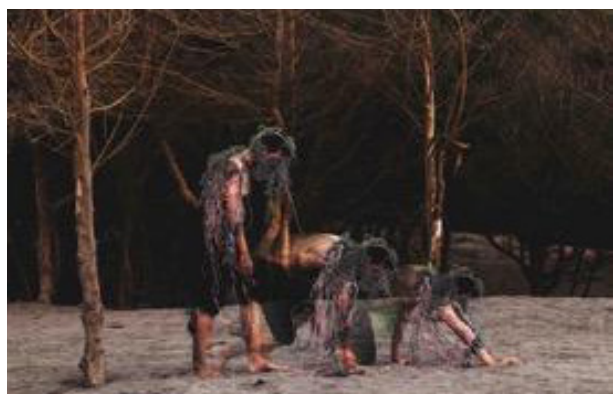
Karya 2 Dying 2019 40cm x 60cm Cetak digital pada kertas doff

Pada karya dua nampak manusia yang tubuhnya dipenuhi tali dari sisa-sisa jaring. Karya ini memperlihatkan pergerakan