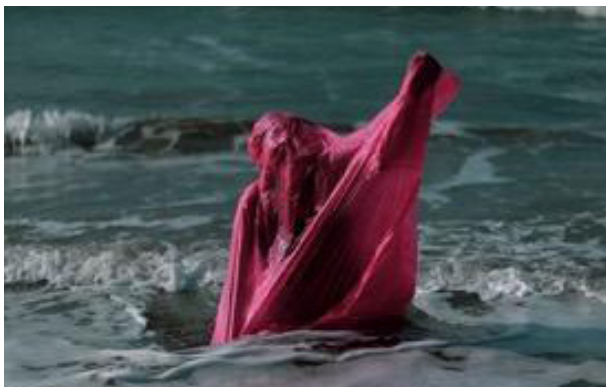
Karya 6 The Raincoat 2019 40cm x 60cm Cetak digital pada kertas doff

Pada karya enam nampak manusia yang sedang berusaha keluar dari dalam jas hujan plastik. Saat ini jas hujan plastik banyak sekali digunakan ketika hujan datang. Bentuknya yang praktis dipakai dan dapat dilipat menjadi kecil agar mudah dibawa menjadi alasan utama jas hujan plastik banyak dibeli. Jas hujan plastik tidak hanya dapat dipakai ketika hujan saat mengendarai motor tetapi juga dapat dipakai ketika hujan saat menonton konser