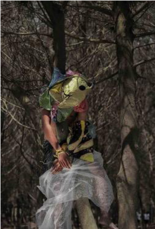
Karya 1 Balonmu Menyiksaku 2019 40cm x 60cm Cetak digital pada kertas doff

seekor burung yang mati karena tubuhnya terlilit balon plastik.