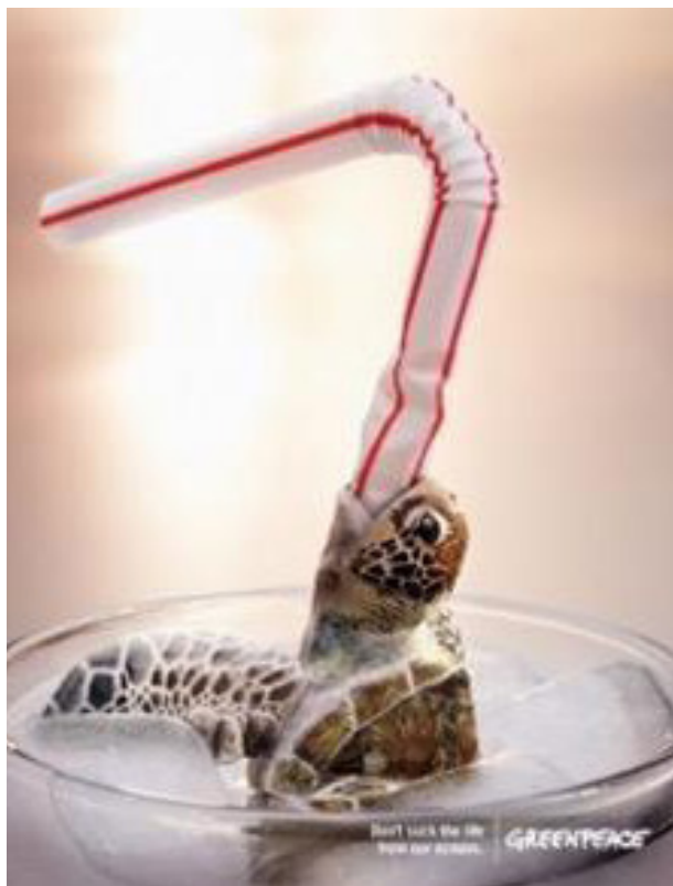
Gambar 3. Greenpeace.

Karya foto yang menjadi tinjauan yang kedua, yaitu karya dari Jeremy Carroll, seorang seniman dan fotografer profesional yang menampilkan objek manusia yang terjerat sampah plastik dengan maksud menceritakan tentang dampak dari polusi plastik yang banyak terjadi di lautan. Wajah dari model pada karya ini tidak diperlihatkan dan karya ini menggunakan teknik highkey yang dilakukan di dalam ruangan, dengan menggunakan lampu studio. Karya